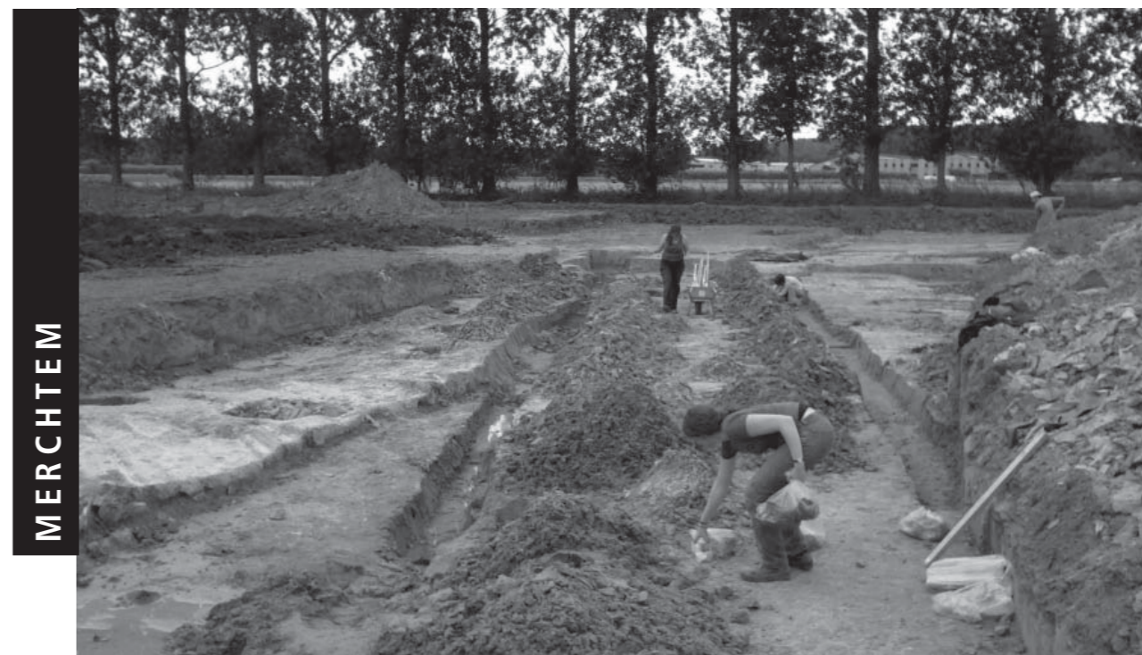
De parallelle grachten na opgraving

De villa werd in latere tijden volledig uitgebroken en vergraven tot op het niveau van de onderkant van de funderingen. De ongeveer 70 cm brede en 20 cm dikke funderingen bestaan uit een stevig en dicht pakket van kiezelsteentjes en bleven grotendeels onaangeroerd. Van de muren daarentegen, resten nog slechts enkele stenen in het uitbraakspoor, met name rechthoekige Doornikse kalkstenen van het parement