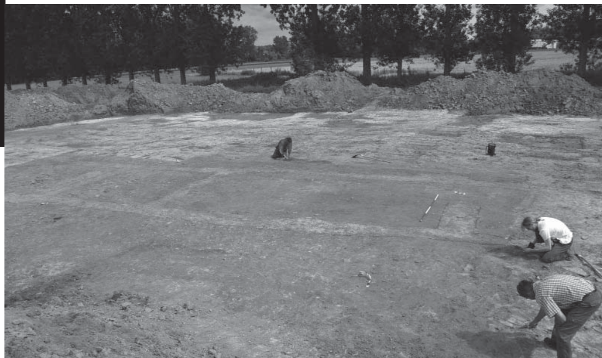
Zicht op een aantal vertrekken aan de achterzijde van het hoofdgebouw