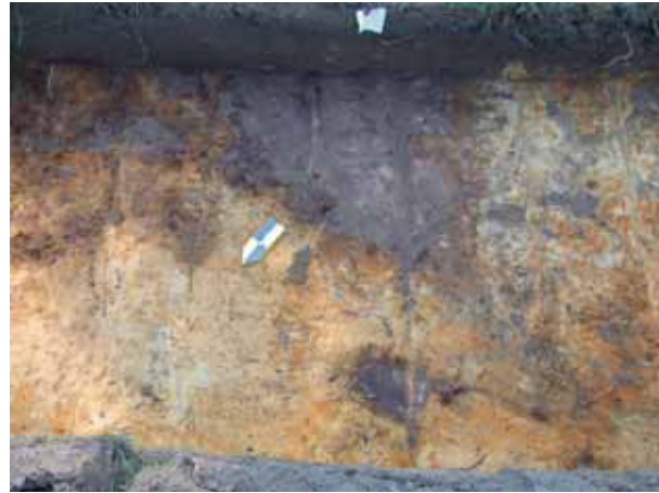
afb. 7: Profiel 15: ploegsporen in de harde ondergrond