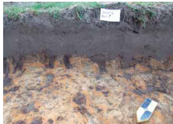
afb. 4: Profiel 1: dunne teeltlaag en bioturbatie, voornamelijk boomwortelsporen (Stad Gent, Dienst Stadsarcheologie)