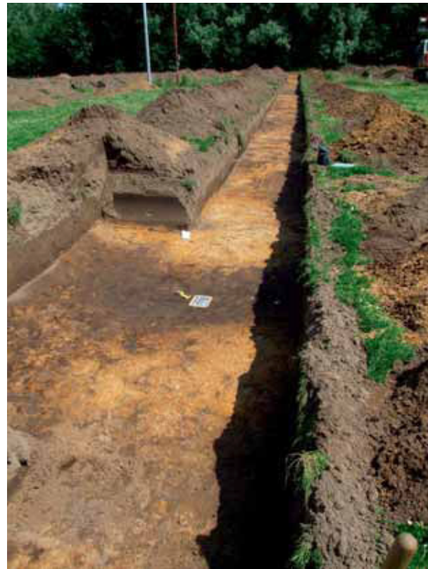
afb. 8: Spoor 12: een windval