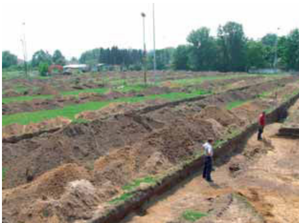
afb. 3: Overzicht van het terreinwerk (Stad Gent, Dienst Stadsarcheologie)