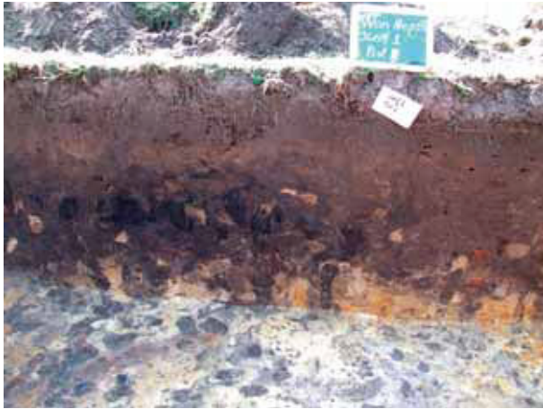
afb. 5: Profiel 2: dikke teeltlaag en bioturbatie, voornamelijk mollengalerijen (Stad Gent, Dienst Stadsarcheologie)