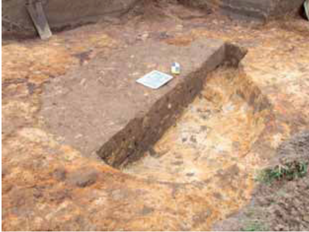
afb. 9: Spoor 4