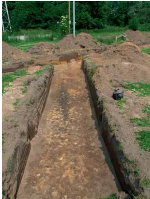
afb. 12: Het lineaire spoor 23