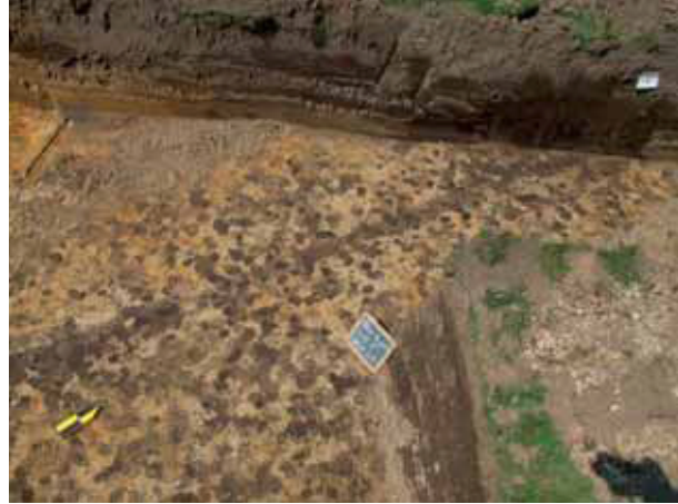
afb. 11: Het lineaire spoor 21 (Stad Gent, Dienst Stadsarcheologie)