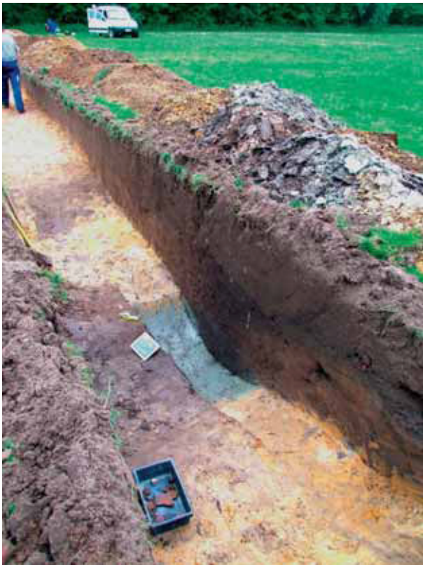
afb. 6: Spoor 2: de perceelsgracht