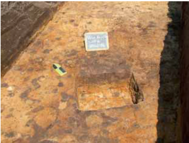
afb. 10: Spoor 13, mogelijk een paalkuil