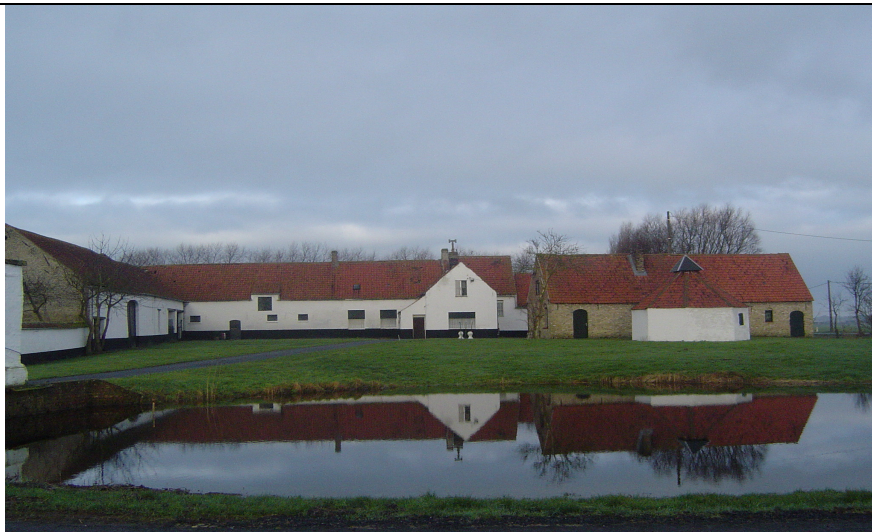
Fig. 4 Huidig zicht op de hoeve met gracht.