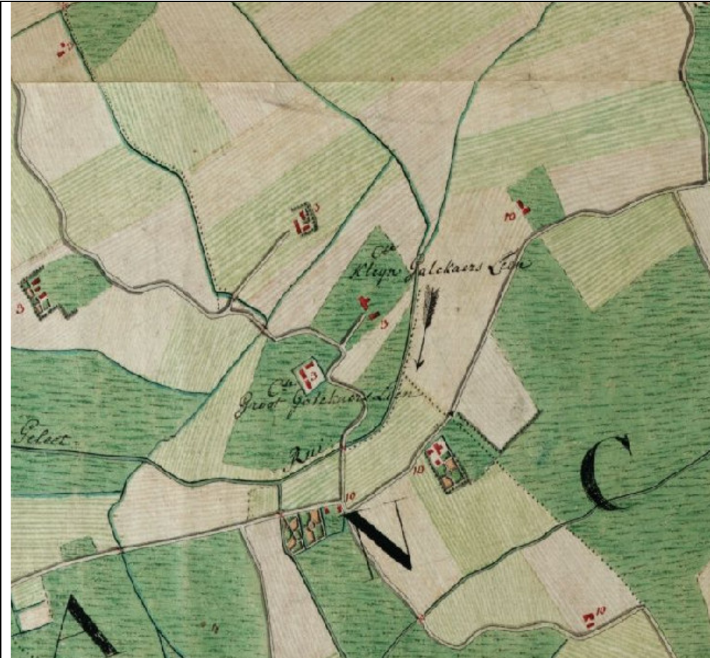
Fig. 3 Uittreksel uit de Ferrariskaart (1771-1778) met aanduiding van het ‘Groot Galckaert Leen’.