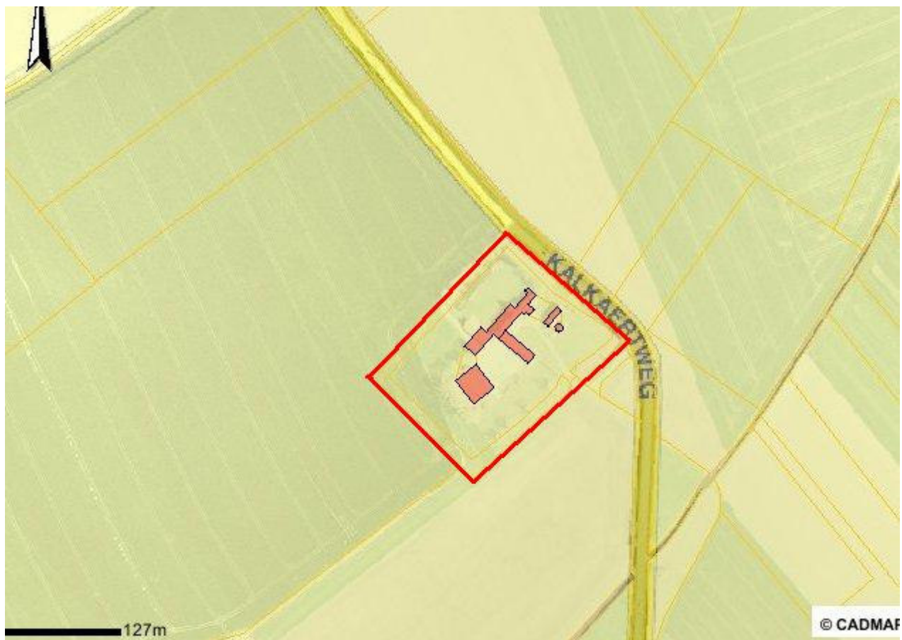
Fig. 1 Kadastrale kaart.

De bodemkaart geeft aan dat de ondergrond bestaat uit overdekte kreekkruggronden en in de noordoosthoek uit dekkleigronden.