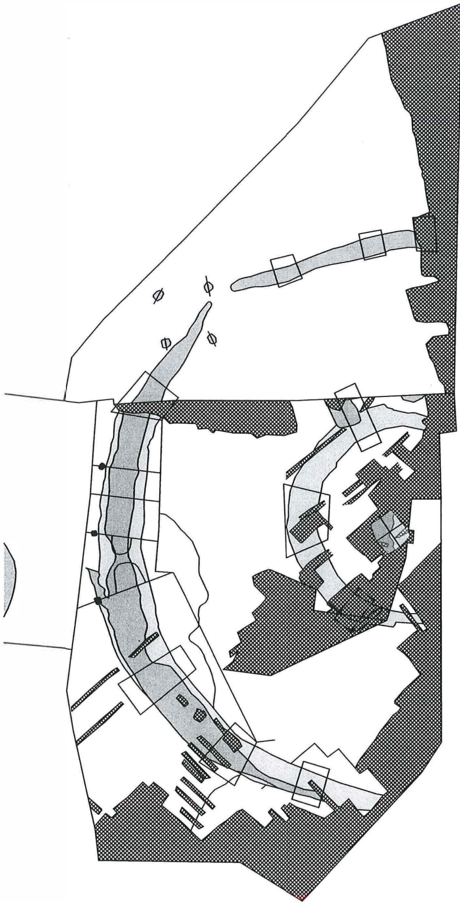
Fig. 8. Kruibeke-Hogen Akkerhoek: de dubbele grafcirkel.