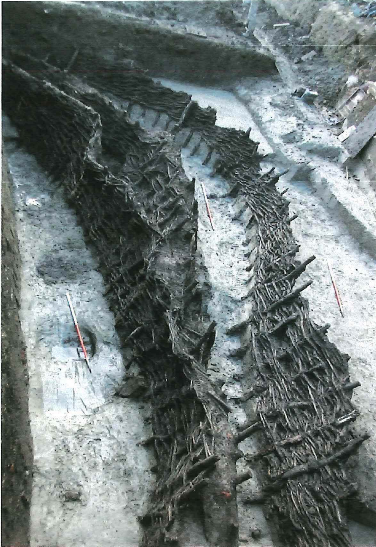
Fig.2 Zicht op de vlechtwerk-oeverbeschoeiingen van de drenkpoel

afval. Enerzijds was er allerlei materiaal dat in verband gebracht kan worden met de economische activiteiten rond de Veemarkt, zoals specifiek slachtafval van runderen (vele honderden runderkaken), leerlooierij (hoornpitten) en afval van bot- en gewebewerking (halfafgewerkte producten in bot en gewei). Anderzijds werden grote hoeveelheden huishoudelijk afval aangetroffen. Door de sterke humeuze component van de vullingen was ook het organisch materiaal goed bewaard gebleven.