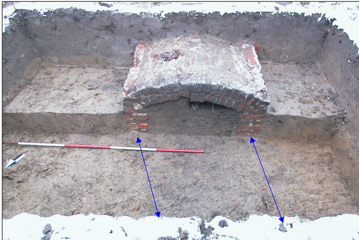
Figuur 5: Grachtaflijning