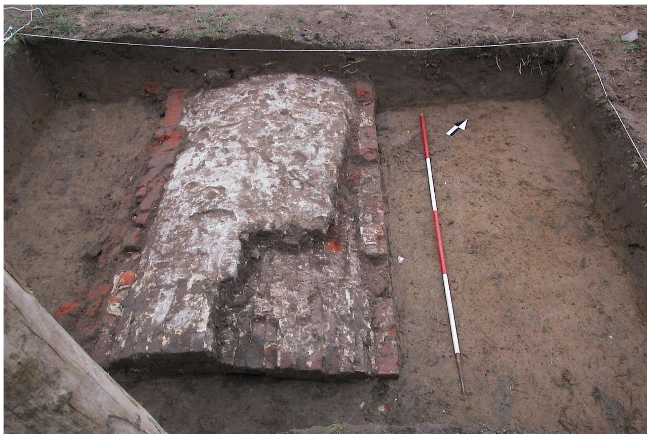
Figuur 3 : Bovenaanzicht duiker

De baksteenformaten sluiten aan bij de baksteenformaten (23 cm x 5 cm x 11 cm) die gebruikt werden bij de constructie van de langsmuren van de Lange Gracht op de abdijsite te Ename. Het toponym Lange Gracht is voor het eerst terug te vinden op de kaart van J. Baele (1661-1663). De bakstenen langsmuren maken deel uit van een laat 17 de eeuwse – begin 18 de eeuwse herinrichting van de Lange Gracht.