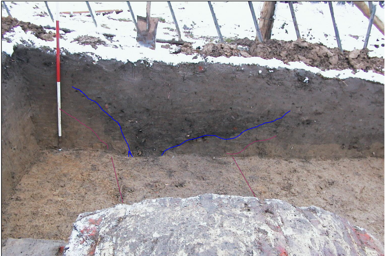
Figuur 6: Situering van de gracht in profiel. - de oorspronkelijke gracht - de 21 ste eeuwse demping van de gracht

Gezien de bovenvermelde info omtrent de inrichting van het Bos t'Ename , gekoppeld aan het baksteenformaat van de structuur, lijkt het vrij aannemelijk dat de structuur in de tweede helft 17 de – eerste helft 18 de eeuw te situeren valt.