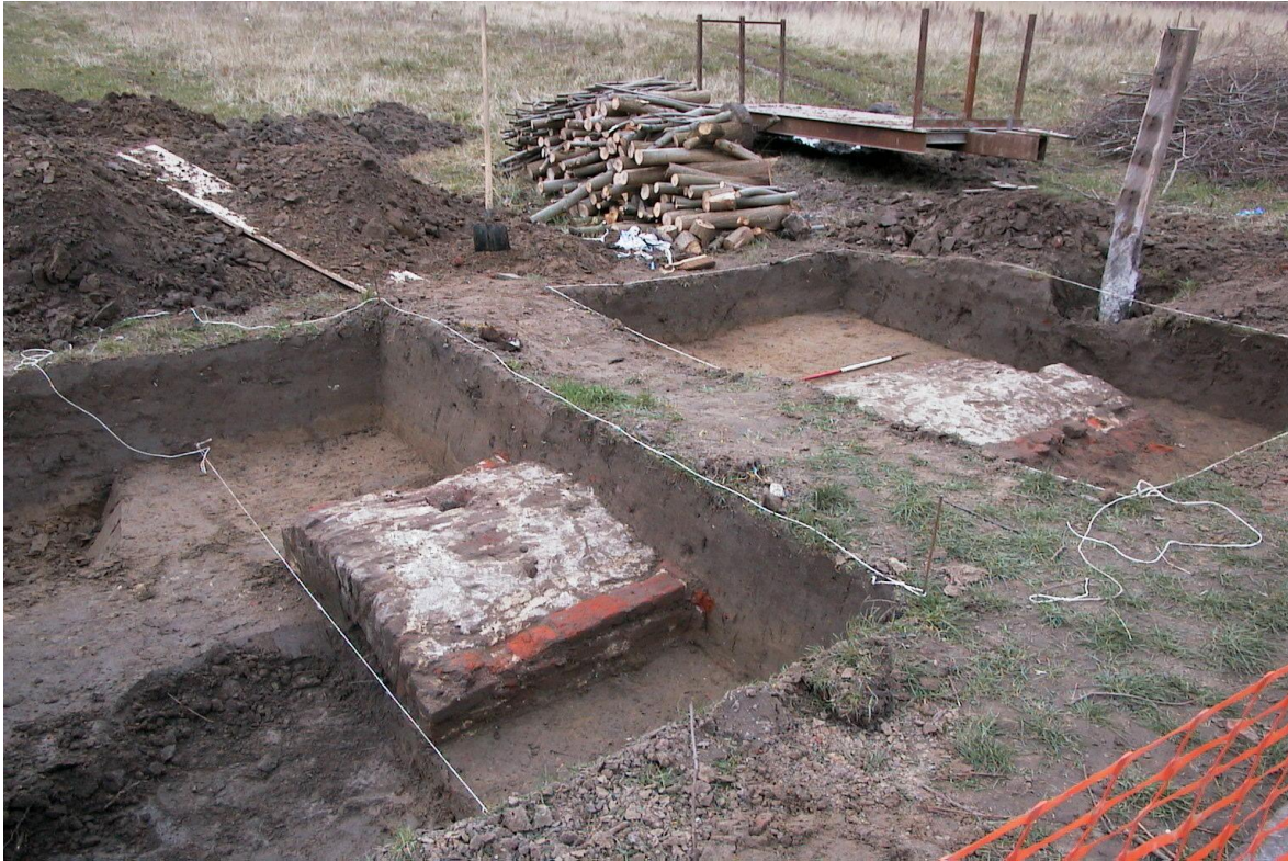
Figuur 4: Bovenaanzicht duiker