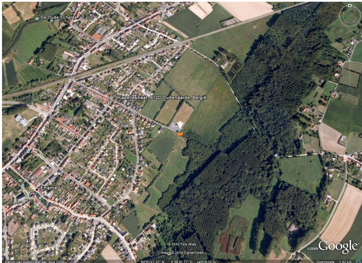
Figuur 1: Aanduiding locatie op Google-earth

De constructie situeert zich op het eind van de Kapellestraat, net op de hoek van de parking van het voetbalveld van Nederename en ter hoogte van huidige toegangsweg tot het Bos t'Ename.