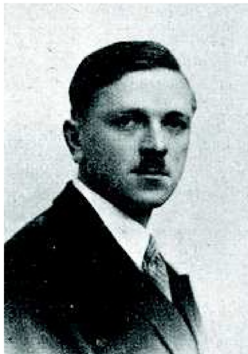
Ryc. 2. Mieczysław Klimaszewski