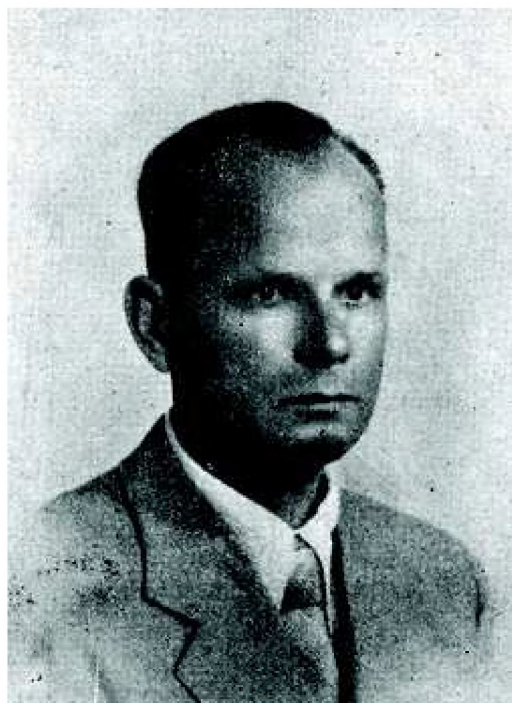
Ryc. 3. Ludwik Sawicki (fot. anonim 1939)