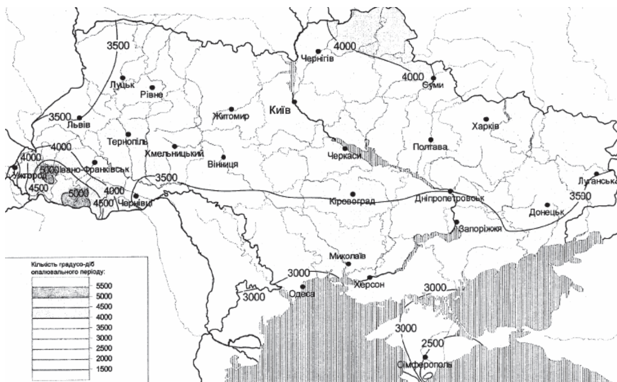
Рис. 3 – Районирование территории Украины по количеству градусо-дней отопительного периода [20]

В качестве примера была рассмотрена реализация энергетической установки на биомассе для г. Запорожье, имеющего средние значения по температурным показателям наружного воздуха. Для других регионов Украины такая установка будет типовой, что позволит обеспечить серийность мини-ТЭЦ на биомассе и уменьшит их стоимость.