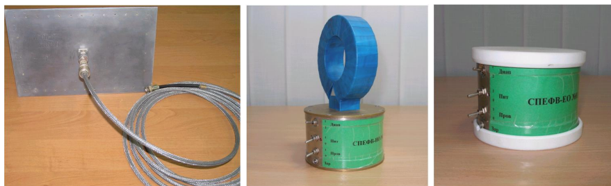
а б в