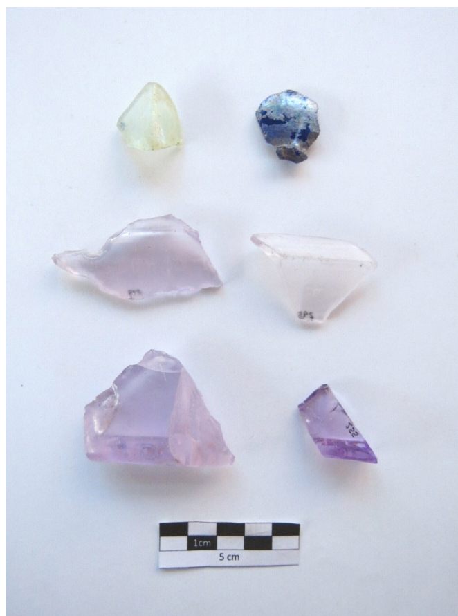
Figura 3. Fragmentos de bases y cuerpos de frascos medicinales de comienzos de siglo XX.

Las huellas y marcas posdepositacionales más comunes que presentan los fragmentos vítreos son las líneas