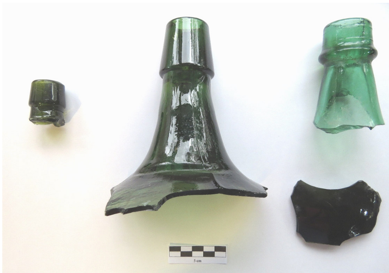
Figura 4. Pico de botella de vino (jerez) de finales del siglo XIX (1890/1900). Picos y base de damajuanas correspondientes a 1920/30.

(83.9 %), tornasolados (56.1 %), lascas (2.8 %), lascados continuos sobre bordes (1.6 %), trizaduras (11.7 %), lascados aislados (72 %) y adherencias (0.3 %). Estas huellas se interpretarían como recurrentes dentro de los procesos posdepositacionales . Un estado mayor de alteraciones se evidencia en los fragmentos que presentan exfoliación (21.5 %) y termoalteración (1.8 %). La exfoliación está relacionada con las características químicas de la pasta del vidrio, como así también con el pH y tipo de suelo en el que estaban depositados los restos vítreos. Los fragmentos que presentan signos de termoalteración se relacionan con la posible exposición o cercanía a fuentes de calor.