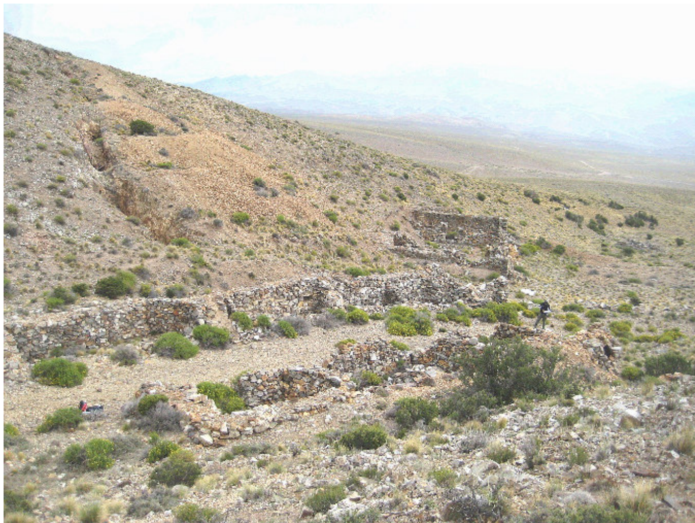
Figura 2. Vista de las instalaciones administrativas-habitacionales de MPS.

1900-1950), evidenciada por abundantes restos de vidrio y elementos metálicos, escasas lozas whiteware y un zapato masculino (Sironi 2016).