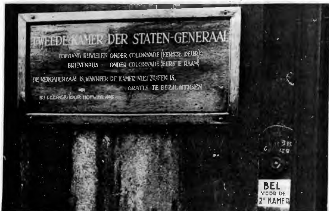
KLIB/KDC Nijmegen