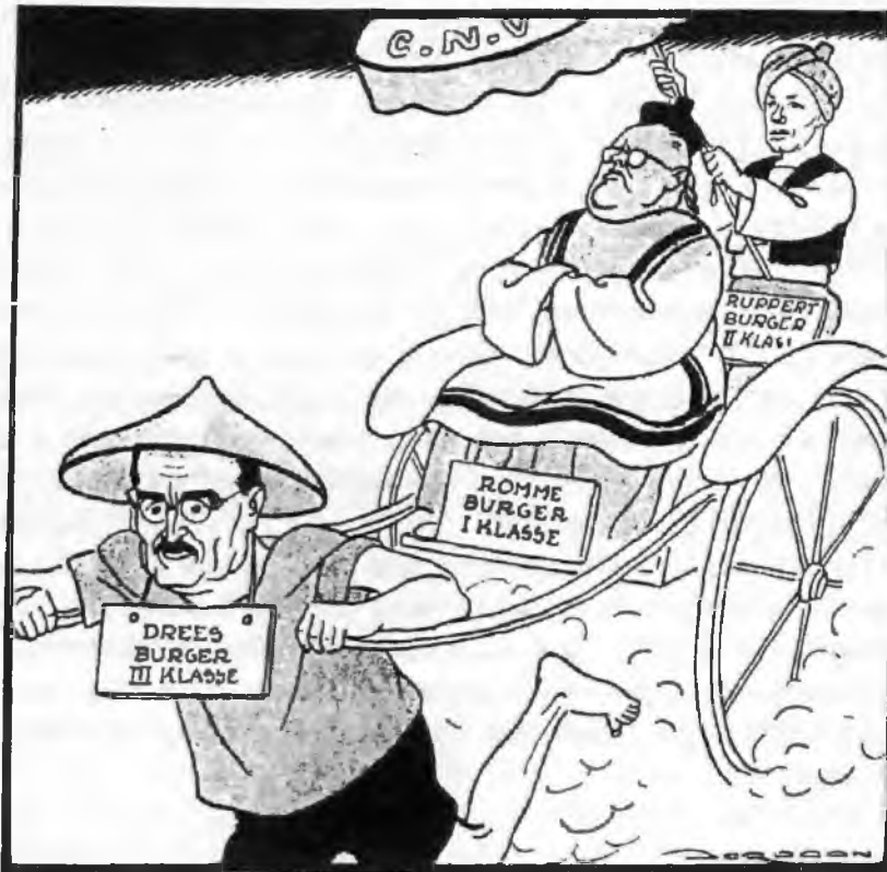
Hun idee van politieke samenwerking Karikatuur Jordaan, Vrij Nederland , 10 juli 1954

opereerde in het verzuilde journalistieke bestel? Vond hij een stok om Het Parool te slaan, dat zich bijzonder negatief had uitgelaten over het mandement? 36