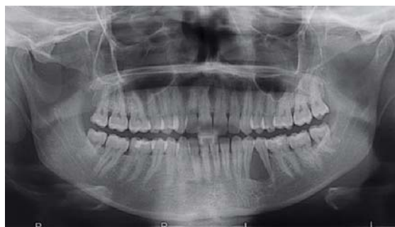
Afb. 2. Op de panoramische röntgenopname is tussen gebitselementen 34 en 35 een goed begrensde radiolucente afwijking zichtbaar met divergentie van de radices van de betrokken gebitselementen.

anterieure en posterieure richting te kunnen beoordelen, werd een cone beam-computertomogram (cone beam-CT) vervaardigd. De verkregen data werden afgebeeld in dwarsdoorsneden en in een driedimensionale weergave (afb. 3). Daarop was duidelijk te zien dat het foramen mentale aan de afwijking grensde, maar er geen onderdeel vanuit maakte. Het dak van de canalis mandibulae, iets meer posterieur gelegen, liet op de dwarsdoorsneden daarentegen wel een relatie met de afwijking zien. Er was uitgebreid parodontaal aanhechtingsverlies rondom gebitselementen 34 en 35, waardoor de prognose van deze gebitselementen ongunstig was.