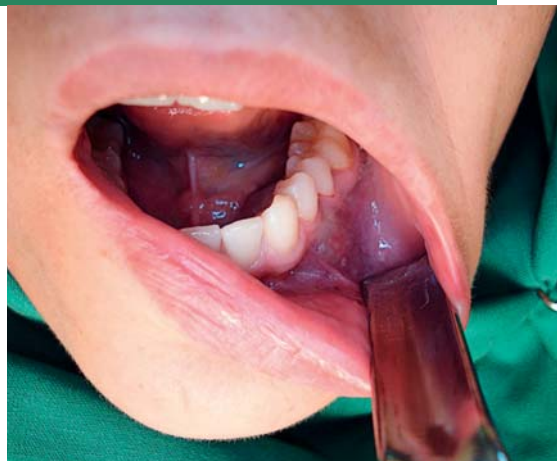
Afb. 1. Zowel linguaal als buccaal van gebitselementen 34 en 35 is een blauw-doorschmerende zwelling zichtbaar.

Om de mogelijke relatie van de afwijking met het foramen mentale en de canalis mandibulae als ook de uitbreiding in