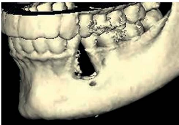
Afb. 3. Driedimensionale reconstructie van de cone beam-CT-data. Het foramen mentale is net caudaal van de afwijking gelegen.