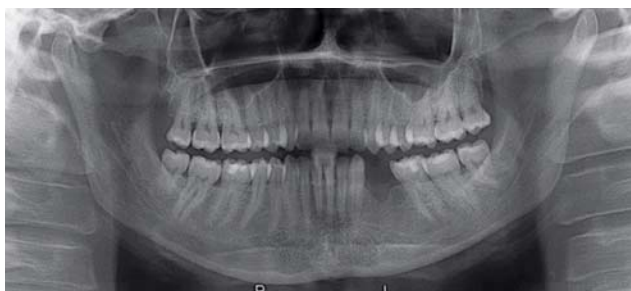
Afb. 5. Panoramische röntgenopname 1 jaar na de behandeling.

incisie een trapeziumvormige buccale mucoperiostlap geprepareerd. Deze liet zich gemakkelijk scheiden van de onderliggende blauwe solide tumor tussen en rond de radices van gebitselementen 34 en 35. Na verwijdering van de gebitselementen 34 en 35 kon de afwijking geheel worden verwijderd. De wond werd primair gesloten. Wortelresorptie, hoewel röntgenologisch niet zichtbaar, bleek na extractie van gebitselementen 34 en 35 toch aanwezig te zijn (afb. 4). Het histopathologisch onderzoek liet een beeld zien passend bij een centrale reuscellaesie.