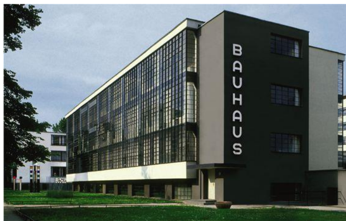
Slika1.: W.Gropius, Bauhaus, Dessau 1925. godina

Dolaskom u Ameriku 1938. godine zbog rata u Njemačkoj, Gropius biva imenovan ravnateljem škole za arhitekturu na Harvardu. Od tada radi, živi i djeluje u Americi sve do svoje smrti 1969. godine. Fotograf i slikar Moholy-Nagy je otvorio novi Bauhaus u Sjevernoj Karolini, a Mies van der Rohe je postavljen za voditelja arhitektonskog odjela Tehnološkog instituta Armour u Chicagu gdje je od njega naručena dvadeset jedna golema zgrada. Muzej moderne umjetnosti je postavio izložbu pod nazivom "Bauhaus 1919. – 1928." u čast Gropiusa i njegovog djelovanja na mjestu ravnatelja. Kasnije u MoMA-i ostaju mogli slikarski radovi i grafike značajnog Kandinskog i mnoštva drugih članova, tad bivšeg Bauhauusa. Razna imena američkih arhitekata i članova umjetničke scene su ostavljala svoje poslove kako bi došli studirati kod bauhausovaca koji su sada došli na njihov kontinent poučiti ih europsko-modernističkom radikalizmu.