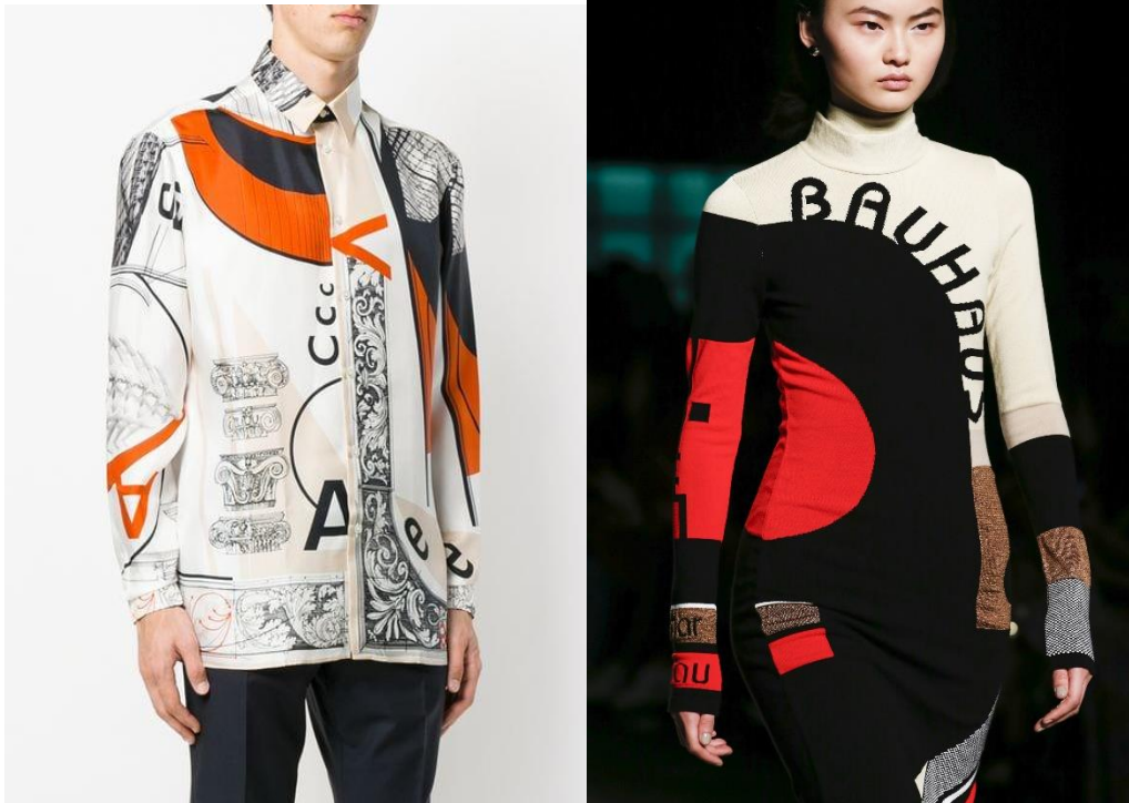
Slika 8. (lijevo): Versace košulja A/W17, 2017. godina

kolekcije inspirirane pokretom modernizma s početka 20. stoljeća, a dio kolekcije na sebi ima ispisano ime Bauhaus. Odjevni komadi s preslikom Bauhaus tipografije oduševili su publiku na London Fashion Weeku u veljači 2018. godine. Sto godina nakon osnutka škole, najveći dizajneri današnjice stvaraju inspirirani školom Bauhaus koja je svoj značaj i dizajn učinila vječnim.