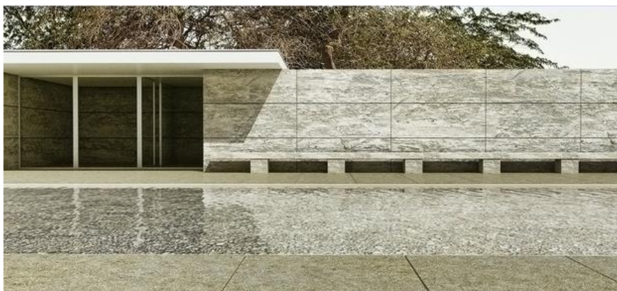
Slika 2.: Mies van der Rohe, Barcelona pavillion, Barcelona 1929. godina

http://mourelask.weebly.com/barcelona-pavilion.html