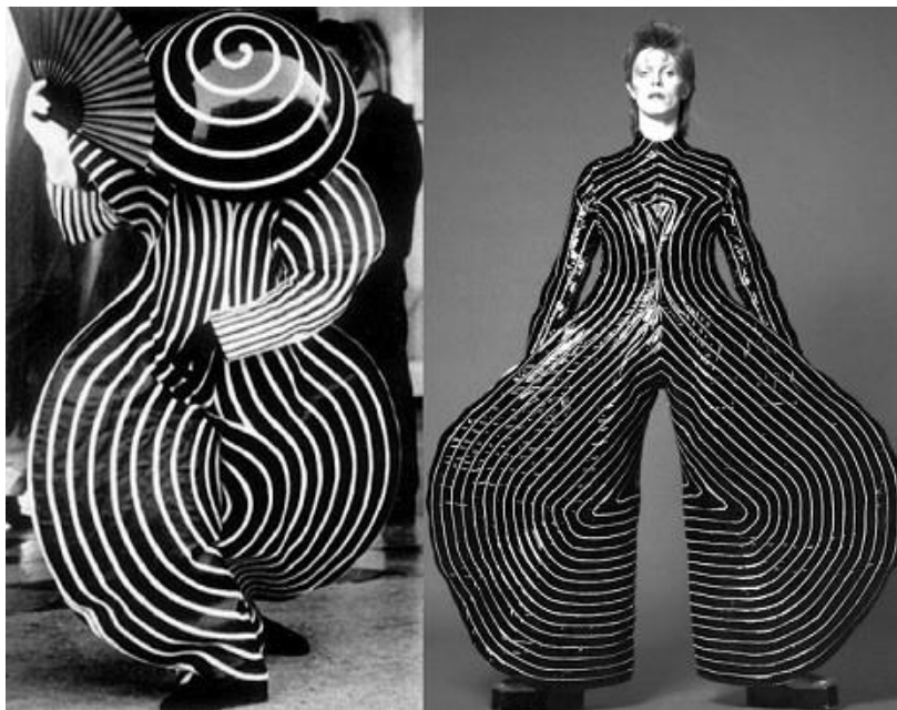
Slika 6.: Desno: Kostim iz Das triadische Balleta, Lijevo: Kostim za Ziggy Stardust, Yamamoto, 1973. godina

https://dangerousminds.net/comments/the_triadic_ballet_eccentric_bauhaus_ballet_brilliance