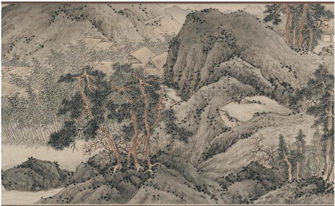
Slika 4: Wen Zhengming, "Peach Blossom Spring", 16.st.

Wen je kineski umjetnik rođen 1470. godine u Suzhou u provinciji Jiangsu. Odrastao je u imućnoj i tradicionalnoj obitelji, po prirodi osjetljiv i povučen. Počeo je stvarati tek u dobi od pedeset i tri godine jer nije bio primljen na poziciju državnog službenika. Bavio se slikarstvom i kaligrafijom te se smatra jednim od najvećih umjetnika dinastije Ming. Bio je najvažniji učenik Shen Zhoua te su se smatrali najvažnijim figurama "Wu" škole. Divio se literatima Yuan dinastije i literatima iz perioda Pet dinastija. Nije pratio niti jedan stil, slikao je od detaljnog do slobodnog. Talentiran i za boju i tuš, najviše se slikao pejzaže te nekada ptice i cvijeće. Umro je 1559. godine u osamdeset devetoj godini života.