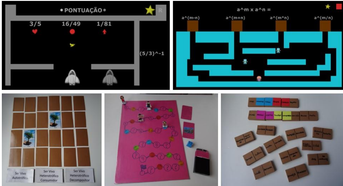
Figura 5: Jogos digitais e não-digitais criados por equipas de alunos do 8º ano