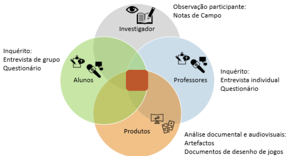
Figura 4: Fontes, técnicas e instrumentos de recolha de dados

A recolha de dados foi realizada com recurso às técnicas de observação participante, inquérito (por questionário e entrevista), análise documental e audiovisual (documentos produzidos e jogos criados). Pretende-se integrar a informação recolhida junto das diversas fontes numa perspetiva de enriquecimento e triangulação de dados (ver Figura 4).