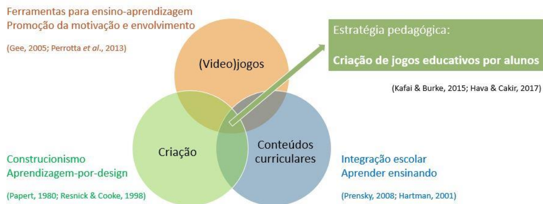
Figura 1: Estratégia pedagógica proposta – Criação de jogos educativos por alunos

São portanto indispensáveis estratégias pedagógicas alternativas para motivar e ensinar alunos em contextos de risco de insucesso escolar, envolvê-los com o seu processo de aprendizagem e, conseqüentemente, com a comunidade escolar. É este o problema em estudo que se pretende abordar colocando alunos no papel de criadores de jogos educativos ( i.e. jogos que incorporam conteúdos curriculares). A Figura 1 ilustra a estratégia pedagógica proposta.