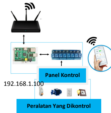
Gambar 2 Uji Coba dengan Jaringan Lokal

Pada Gambar 4.3 diatas tampak sebuah accesspoint yang digunakan sebagai media penghubung antara smart phone dan raspberry yang berfungsi sebagai server, sekaligus berfungsi sebagai perangkat kendali untuk alat Reservoir, MCB, KKB, dan Lampu-lampu, melalui relay . Smart phone berfungsi sebagai pengendali akan mengirim intruksi ke Rapsberry melalui aplikasi berbasis website, dengan IP Address/lokal 192.168.1.100 yang fungsinya untuk mengendalikan Reservoir, KKB, dan MCB.