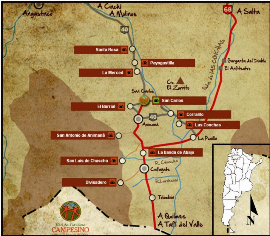
Figura 1. Red de Turismo Campesino