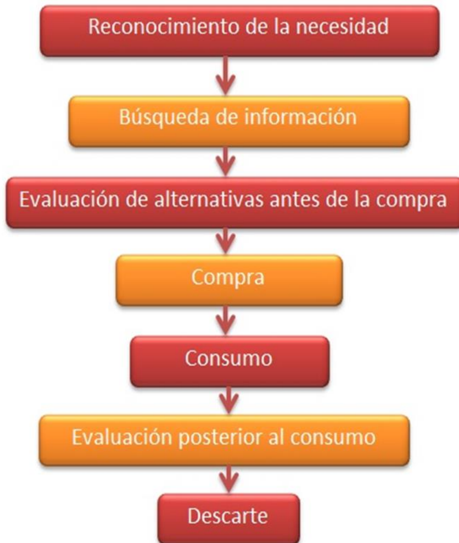
Figura No 1: Proceso de decisión de compra (Consumer, 2007, pág. 391)