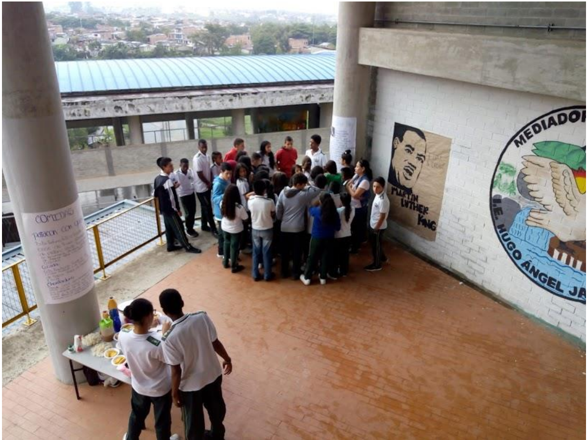
Miércoles 24 de mayo, exposición de autores y movimientos afrodescendientes a la comunidad educativa