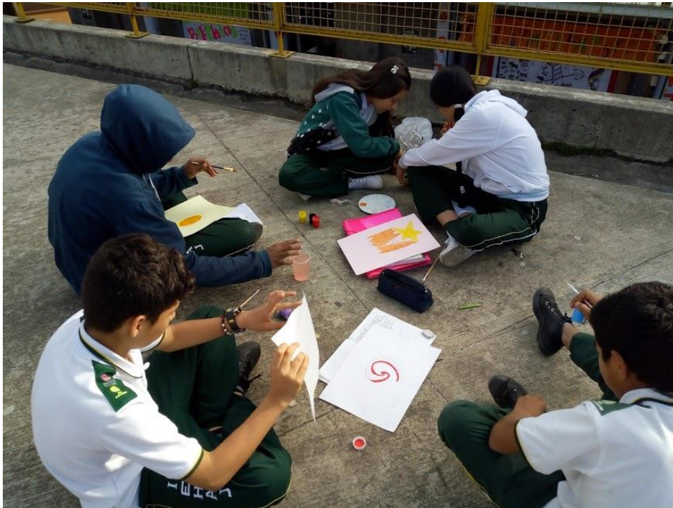
Martes 13 de marzo, grupo 6.3, tema: El universo