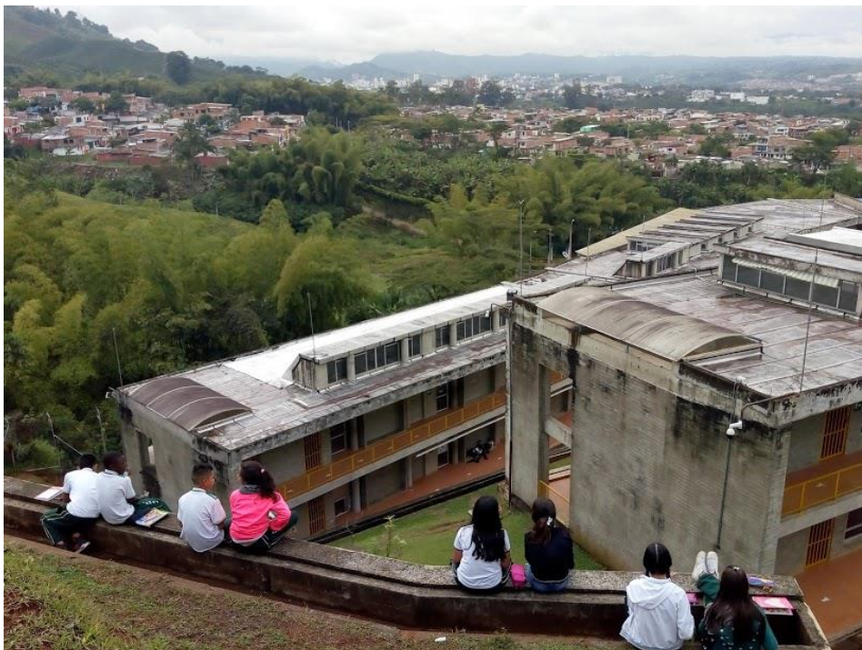
Martes 10 de abril, grupo 6.3, tema: la corteza terrestre