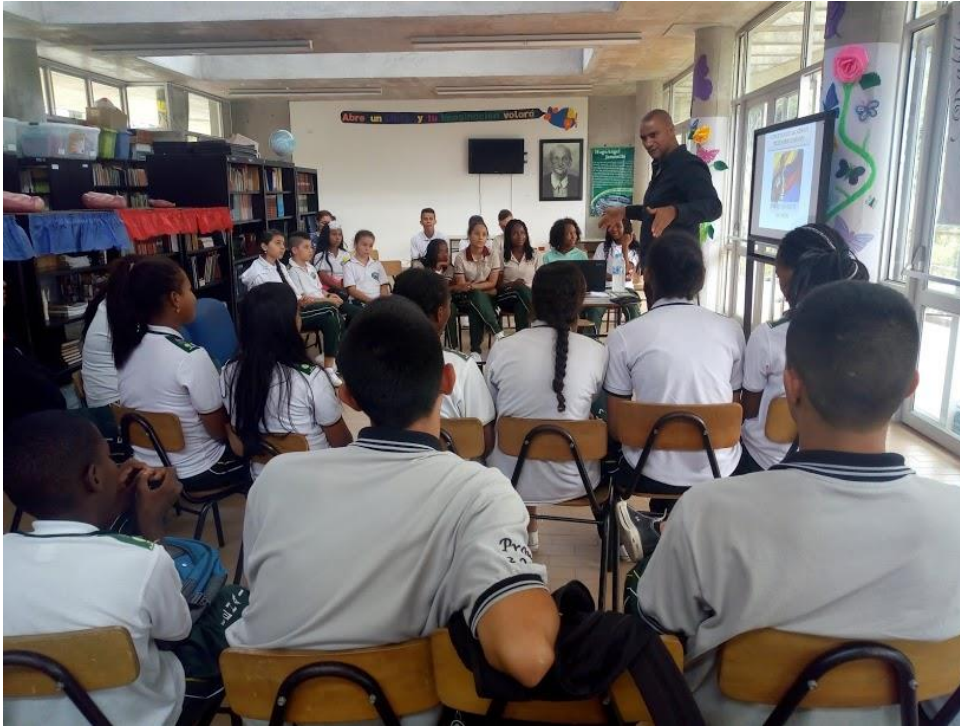
Lunes 2 de abril. Semillero y representantes de aula, Conversatorio sobre afrocolombianidad