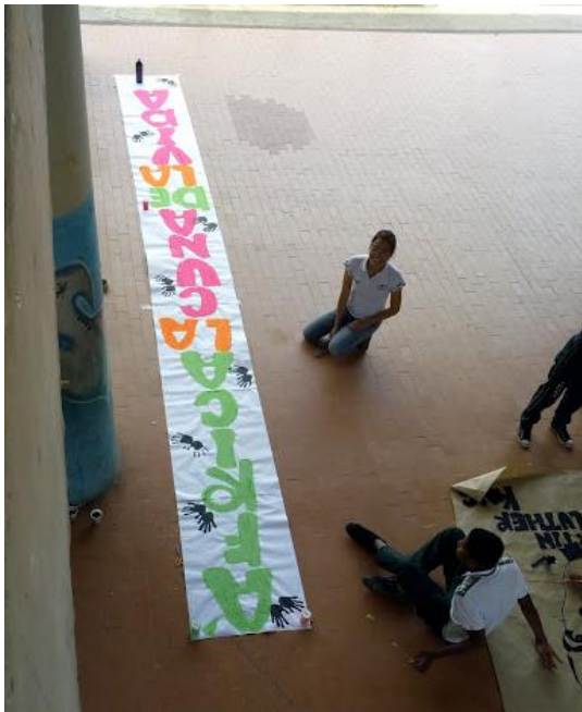
Mural pegado en la entrada del colegio