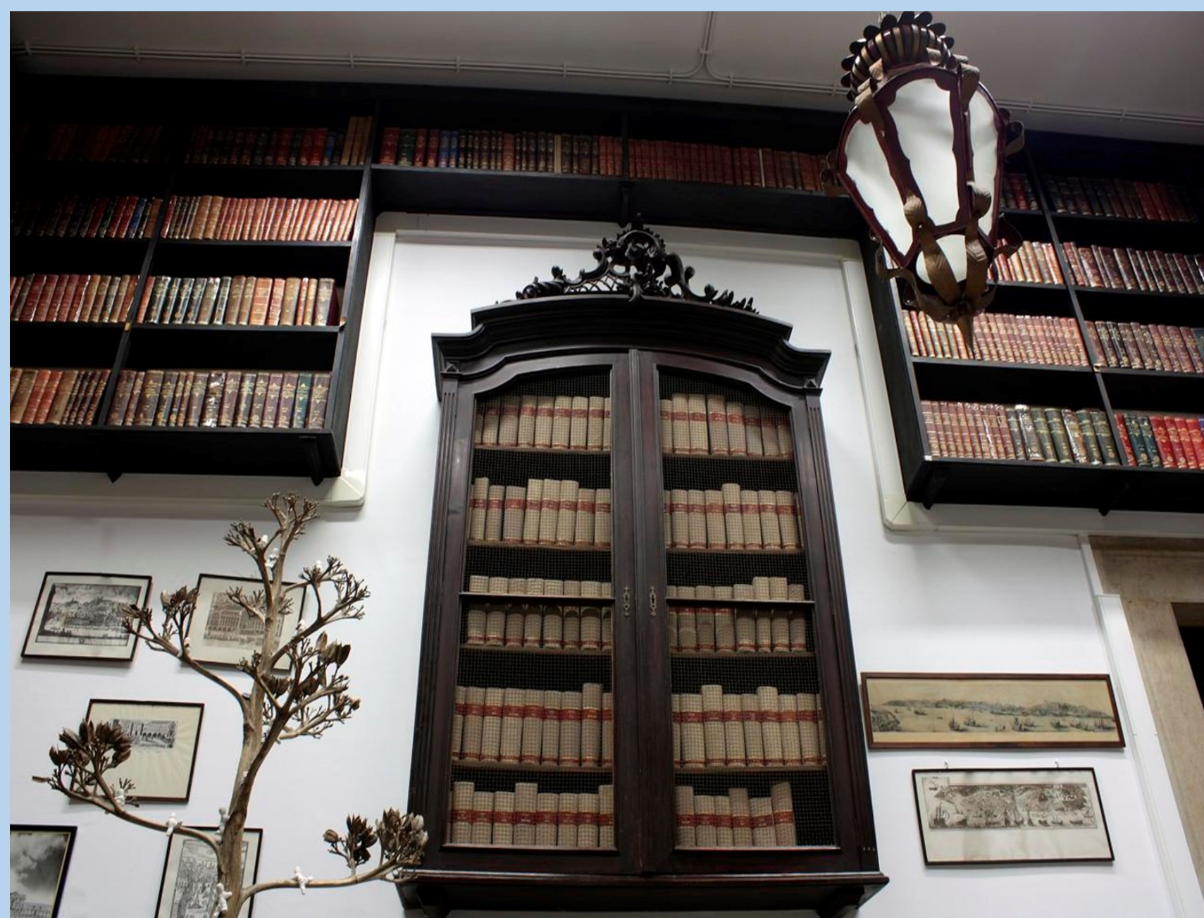
Espólio Documental do Centro Hospitalar de Lisboa Central, EPE

Assim, o CHLC aderiu à rede de Repositórios Científicos de Acesso Aberto de Portugal (RCAAP) em 2011 e tem envidado esforços para registar a investigação desenvolvida na instituição na base nacional oficial, respondendo de forma rigorosa ao Inquérito ao Potencial Científico e Tecnológico Nacional (IPCTN).