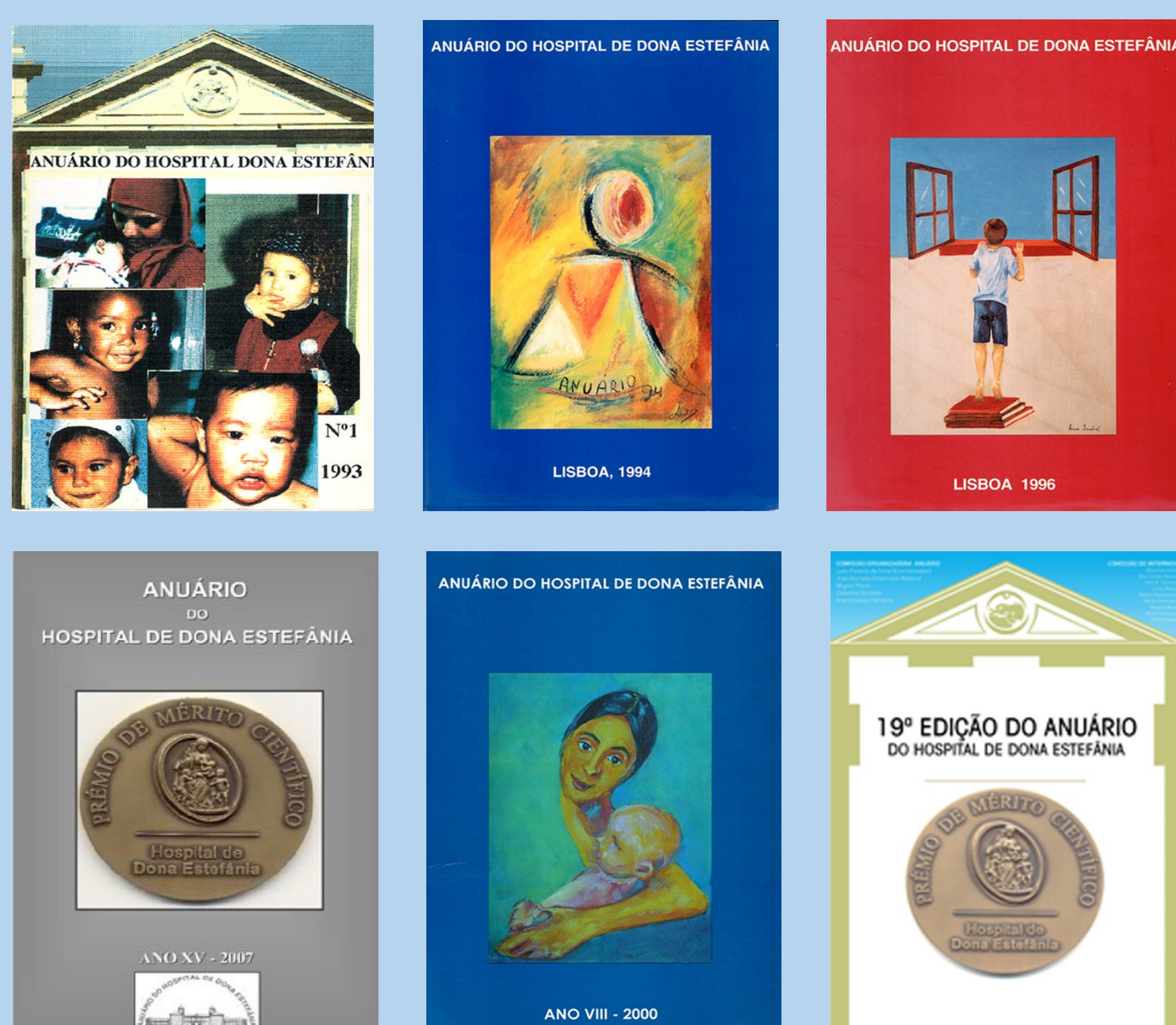
Anuário do Hospital Dona Estefânia (desde 1993)

Inclusão das Teses da Escola Médico-Cirúrgica de Lisboa , na comunidade do Património do Repositório, por forma a preservar a memória antiga da Instituição, uma vez que estas constituem um valioso espólio documental.