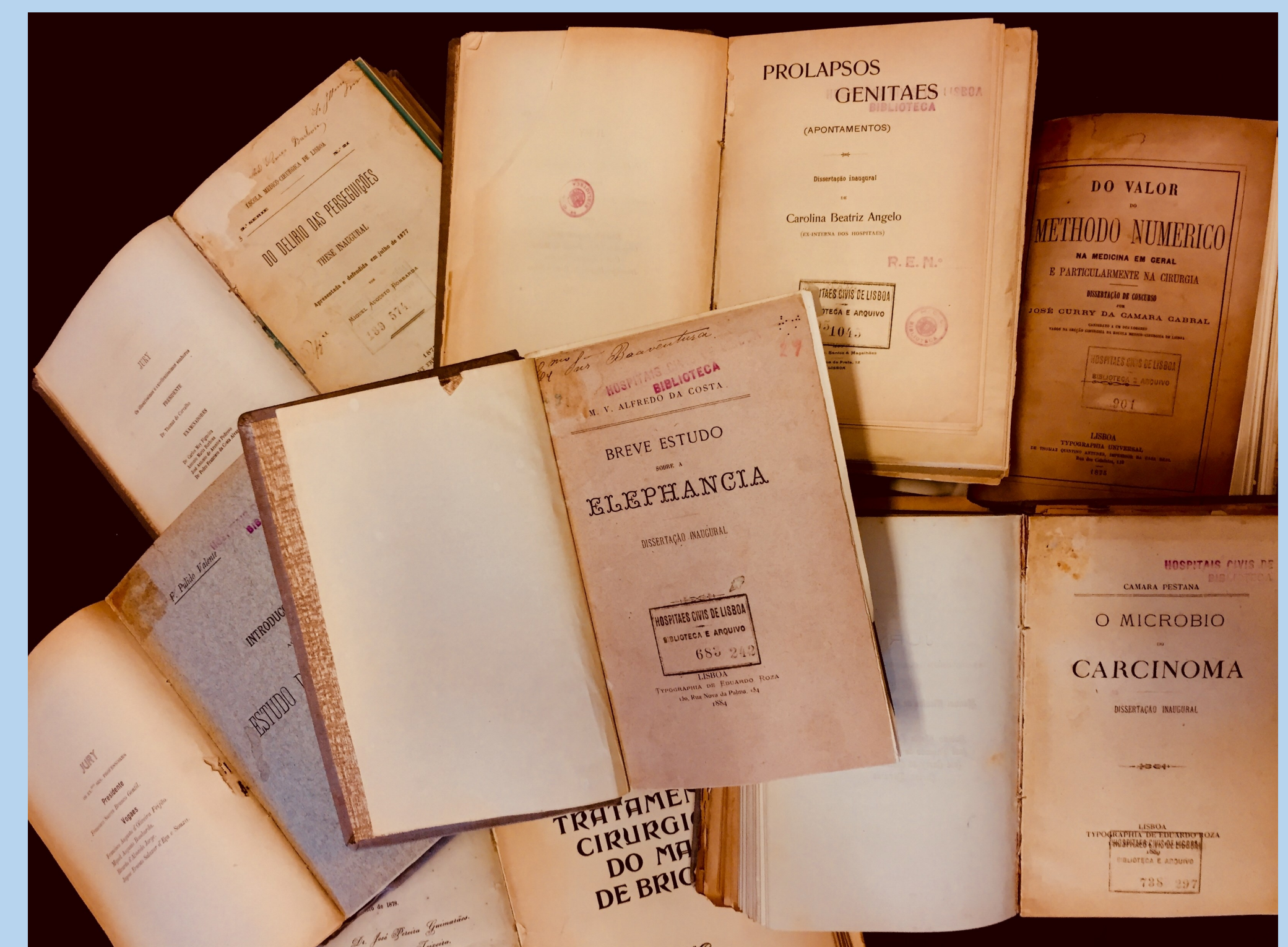
Teses da Escola Médico-Cirúrgica de Lisboa

Pretende ser uma estrutura dinâmica, destinada a incluir os documentos representativos da produção científica, melhorando a sua disponibilidade e acesso tendencialmente aberto, com qualidade crescente de informação relacionada.