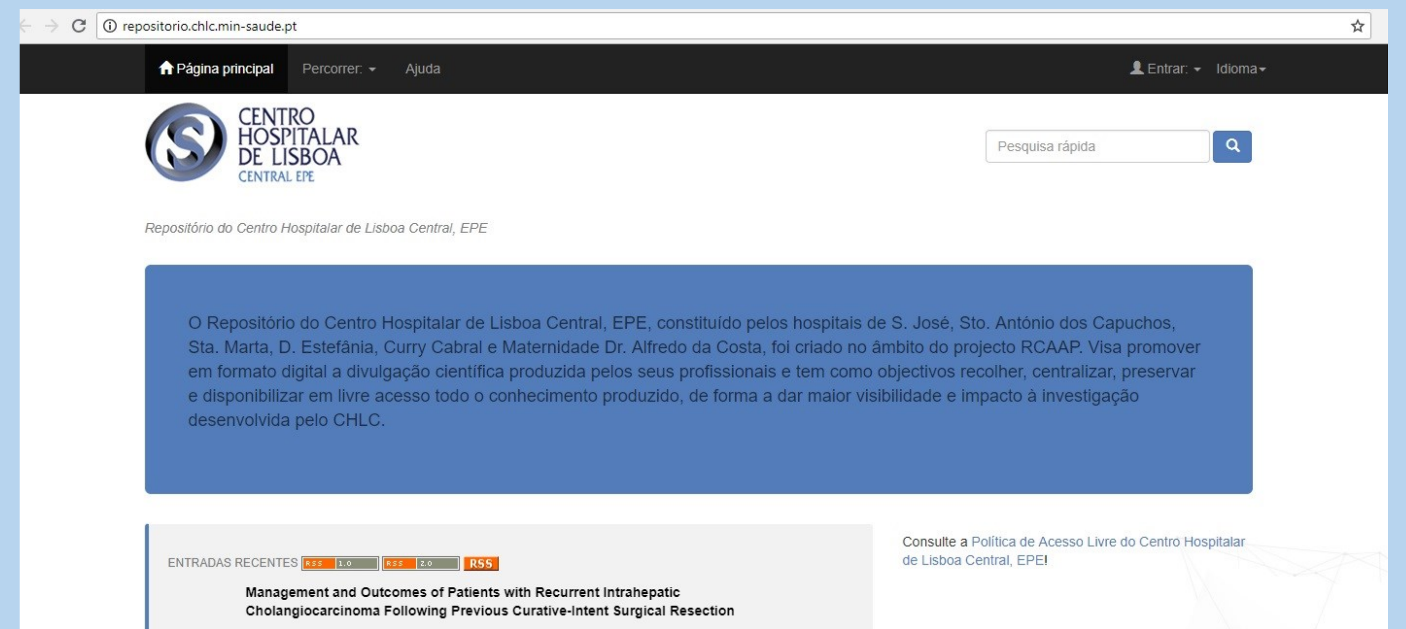
Repositório do Centro Hospitalar de Lisboa Central, EPE

A compilação de toda a produção científica do CHLC num único sítio contribui para o aumento da sua visibilidade e impacto, garantindo a preservação da memória científica deste Centro Hospitalar, uma estrutura assistencial de elevada diferenciação e especialização.