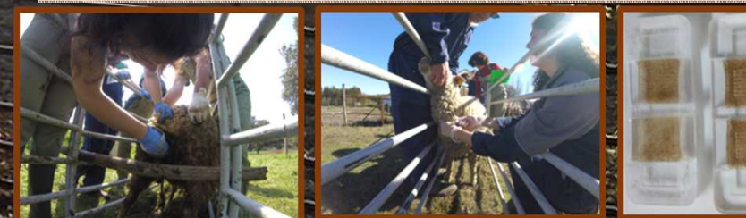
Colheita de fezes