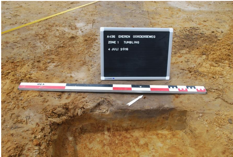
Figuur 4. Doorsnede van spoor 2 (greppel)

Vier van de opgetekende sporen bevinden zich op een rij met een noordoost-zuidwest oriëntatie en onderlinge tussenafstand van 40-50 centimeter. Deze sporen zijn uitgeloogd en de vulling bestaat uit witgrijs matig fijn homogeen zand. Spoor 3 is vierkant, sporen 4, 5, 6 zijn rond; ze hebben een diameter van 20-25 centimeter.