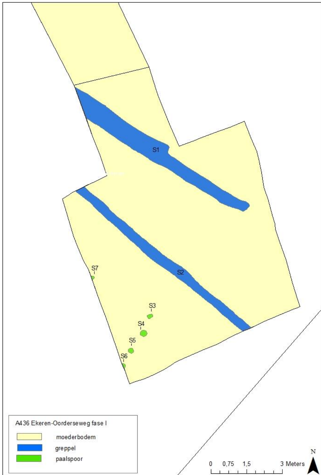
Figuur 8. A436 Ekeren-Oorderseweg – detail opgravingsplan zone 1