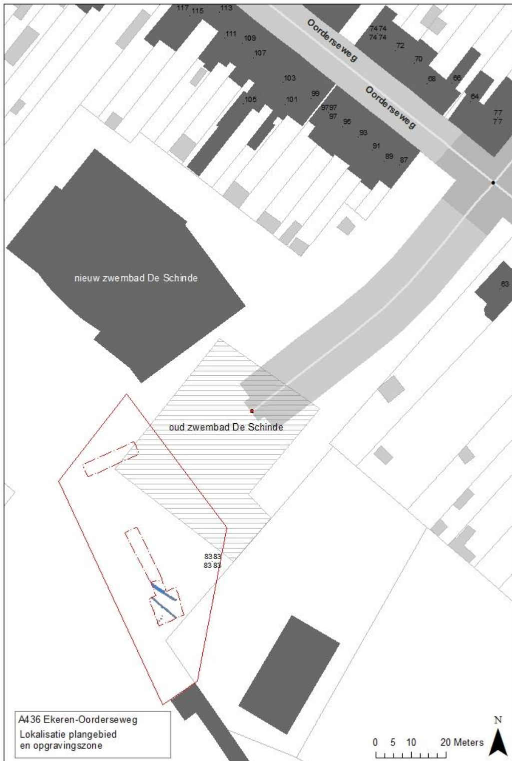
Figuur 1. Situering plangebied en onderzoekszone A436 Ekeren-Oorderseweg