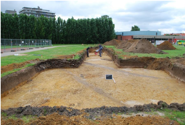
Figuur 3. Uitgraving van de 'valput' met twee langwerpige sporen (greppels)

In het grote vierkante vlak ('valput') in het zuiden van de zone, konden zeven archeologische sporen worden opgetekend. Verder liep er dwars door deze vierkante zone een recent puinpakket met een zuidwest-noordoost oriëntatie dat dezelfde diepte aanhield als de bouwvoor.