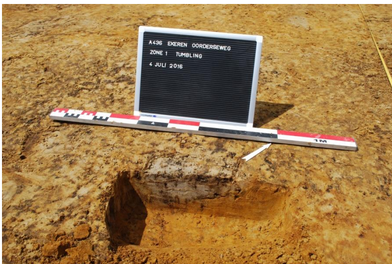
Figuur 5. Dorsnede van spoor 3 (paalkuil)

De sporen werden gecoupeerd: spoor 3 heeft een schuin aflopend rechthoekig profiel met een diepte van 10-6 centimeter, spoor 4 en 6 hebben een komvormig profiel met een diepte van 10 centimeter en spoor 5 heeft een rechthoekig profiel met een diepte van 15 centimeter. Deze sporen worden geïnterpreteerd als paalkuilen. Er werden geen archeologische vondsten aangetroffen in de paalkuilen wat de datering moeilijk maakt. Op basis van vergelijkbare sporen in de site onder het nieuwe zwembad, kan hier een datering in de ijzertijd verondersteld worden.