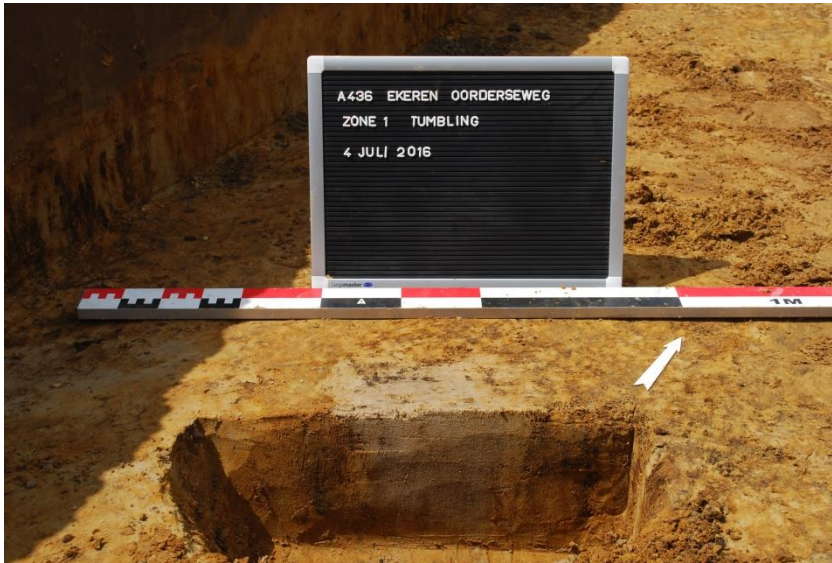
Figuur 6. Doorsnede van spoor 6 (paalkuil)

Spoor 7 tenslotte is een kleine ronde verkleuring met een diameter van 14 centimeter en een vulling bestaande uit donkergrijs, matig fijn zand. De bewaarde diepte is 10 centimeter en het profiel komvormig. Dit spoor is niet uitgeloozd en vermoedelijk recent.