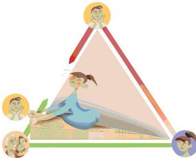
Figuur 3. Twee strategieën in de driehoek

Figuur 3 maakt duidelijk dat begeleiders twee strategieën kunnen kiezen: