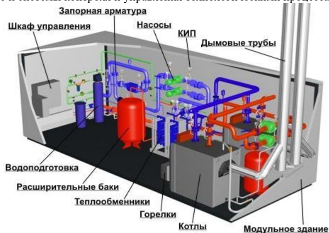
Рис. 1 Схема блочно-модульной котельной [1]

Блочно-модульная котельная представляет собой контейнер (рис.1), в котором расположено технологическое оборудование и системы контроля и управления технологическими процессами.