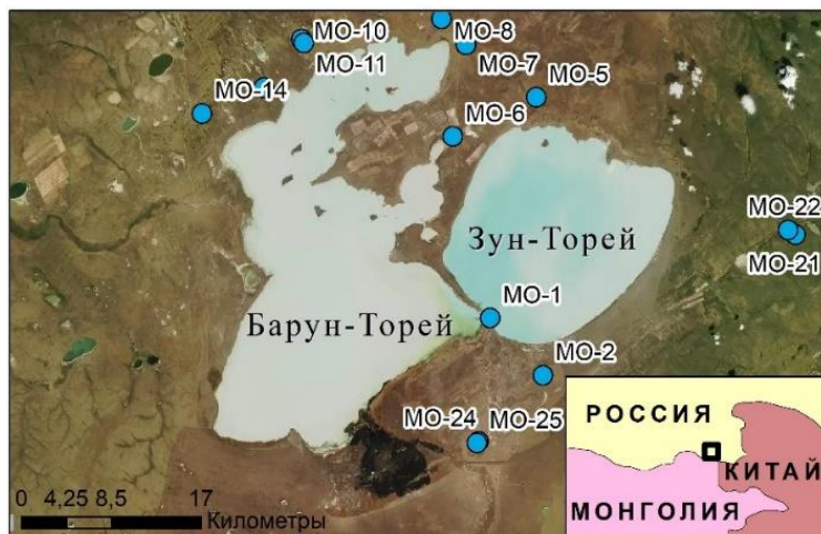
Рис. 1 Обзорная карта района исследований с расположением точек опробования (обозначены голубым цветом)

Изучение химического состава выполнено с использованием различных методов анализа: потенциметрическим методом ( \text{HCO}_3^- , \text{CO}_3^{2-} , \text{Cl}^- и \text{F}^- ), атомной эмиссией ( \text{Na}^+ и \text{K}^+ ), пламенной абсорбцией ( \text{Ca}^{2+} и \text{Mg}^{2+} ), коллометрическим методом (Si, P), фотометрией ( \text{NH}_4^+ , \text{NO}_2^- , \text{NO}_3^- ), \text{SO}_4^{2-} определён в виде \text{BaSO}_4 в кислой среде с помощью гликолевого реагента. Концентрации микрокомпонентов определены с помощью метода ICP-MS.