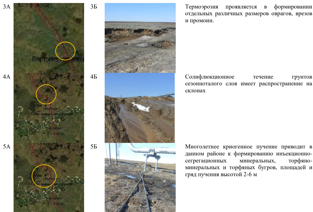
Рис.1. Таблица дешифровочных признаков проявления опасных инженерно-геологических Условные обозначения: А – космоснимки территории; Б – фотографии обследованных участков желтым кругом обозначены места проявления процессов