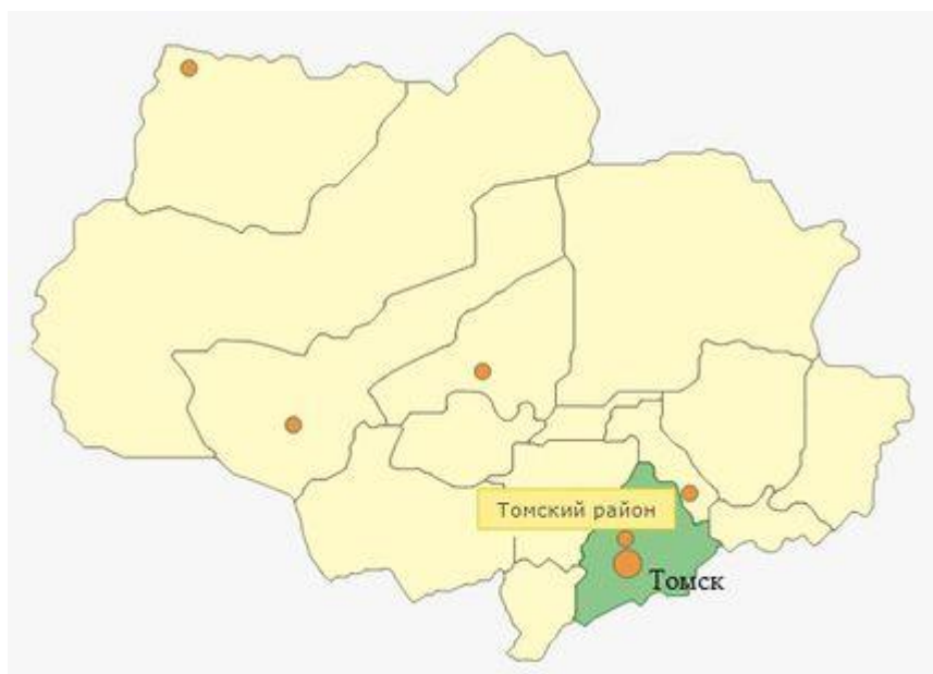
Рисунок 1 – Томский район на карте Томской области.

Томский район граничит на севере с Кривошеинским и Асиновским районами, на востоке – с Асиновским и Зырянским районами, на западе – с Кожевниковским и Шегарским районами Томской области, на юге — с Новосибирской и Кемеровской областями. Площадь района — 10 064,2 км 2 , из них 75 % занимают леса.