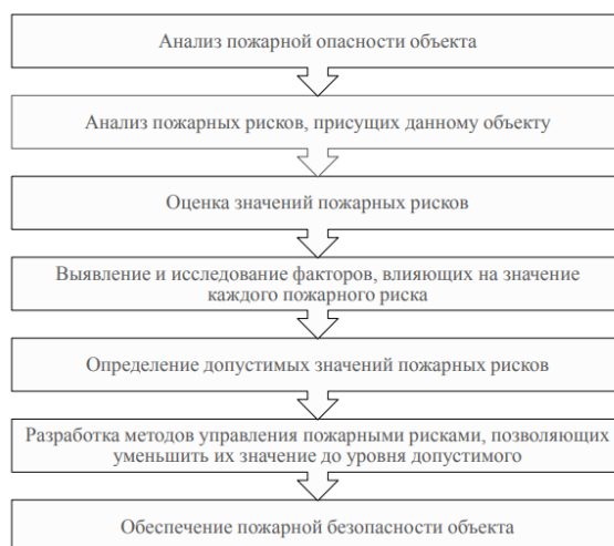
Рисунок 1.1 – Алгоритм обеспечения пожарной безопасности объекта защиты

Проводя анализ пожарной опасности объекта защиты, для начала определяются и анализируются все пожарные риски на данном объекте, затем оценивается их текущее значение и определяются допустимые значения для всех пожарных рисков.