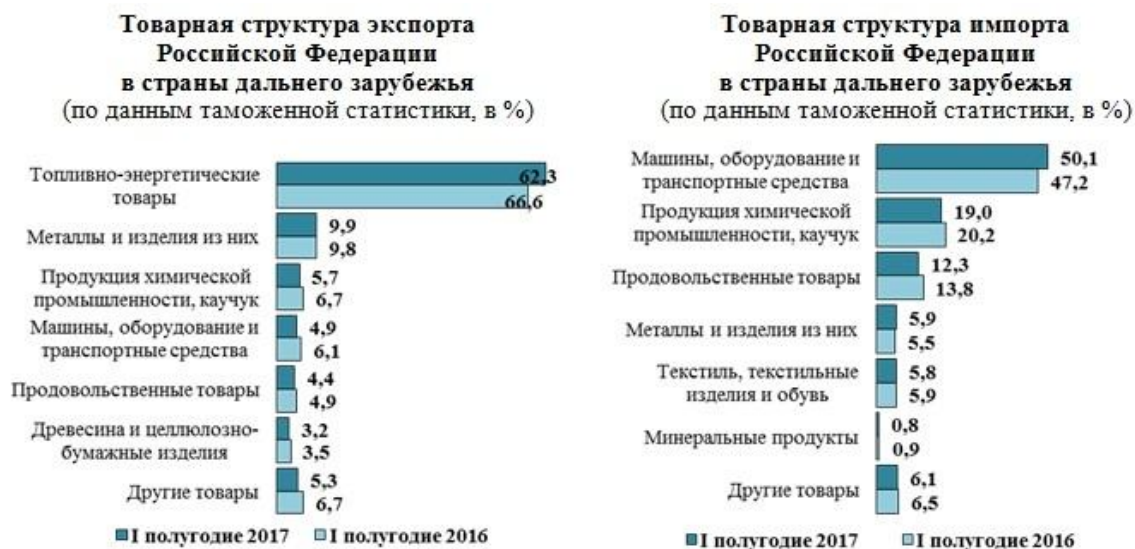
Рисунок 1 - Товарная структура экспорта и импорта России в 2016 году

Более наглядно товарная структура экспорта и импорта России в 2016 году представлена на следующем рисунке: