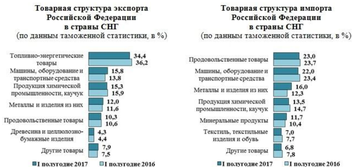
Рисунок 3 - Товарная структура экспорта и импорта России в страны СНГ

В товарной структуре экспорта России в страны СНГ (Рисунок 3) стал выше удельный вес машин, оборудования и транспортных средств, металлов и изделий из них. В то же время стала ниже доля топливно-энергетических товаров, продукции химической промышленности и каучука, продовольственных товаров и сельскохозяйственного сырья, древесины и целлюлозно-бумажных изделий.