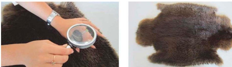
Рис. 2.4. Определение окраски шкурки