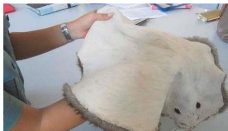
Рис. 2.5. Определение свойств кожевой ткани

Все вышеизложенное свидетельствует об актуальности таможенной экспертизы пушно-меховых товаров, сложности ее проведения и необходимости совершенствования. В частности, целесообразно при проведении товароведческой экспертизы проводить качественную идентификацию по более расширенному перечню показателей, необходимо проводить исследования по разработке идентификационных признаков новых товарных видов для расширения информационно- справочной системы «Атлас волос животных».