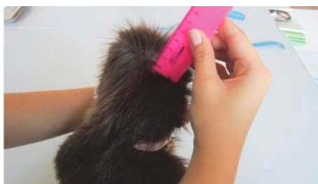
Рис. 2.3. Определение длины остевых и пуховых волос

Для установления идентичного или однородного товара проводится ассортиментная идентификация изделий. По внешнему виду устанавливается вид изделия, вид полуфабриката, способ раскроя шкурок, конструктивные особенности, размерные характеристики. По маркировочным данным определяется страна происхождения. Кроме того, эксперты устанавливают, были ли изделия в эксплуатации. Для получения ответа на этот вопрос эксперты обращают внимание на состояние подкладки и мехового верха изделия: в процессе носки изменение структуры волосяного покрова в первую очередь происходит в нижней части рукавов, по краям борта и нижней части изделия. Степень износа устанавливается, исходя из состояния полуфабриката и изделия в целом.