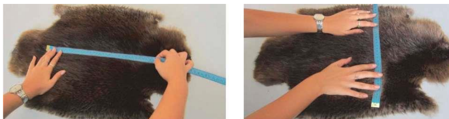
Рис. 2.1. Определение площади шкурки (слева - длина, справа - ширина)

В таких случаях единственно возможной для проведения является экспертиза с применением органолептических методов. В настоящей работе представлены результаты проведенной нами видовой идентификации шкурки бобра речного. Были определены следующие идентификационные признаки данного товарного вида: площадь шкурки составляет 15-50 дм 2 (рис. 2.1); волосяной покров состоит из грубой толстой ости и шелковистого пуха, густота 13-23 тыс. волос на 1 см 2 , на череве она больше, чем на хребте (рис. 2.2); длина остевых волос 3-5 см, пуховых - 1,5-3 см (рис. 2.3); окраска ости на хребте от светло- до темно-бурой или черной, пуха - от темно-бурого до светло-пепельного, волосяной покров на череве несколько более светлого оттенка (рис. 2.4); кожная ткань очень плотная, толстая (рис. 2.5).