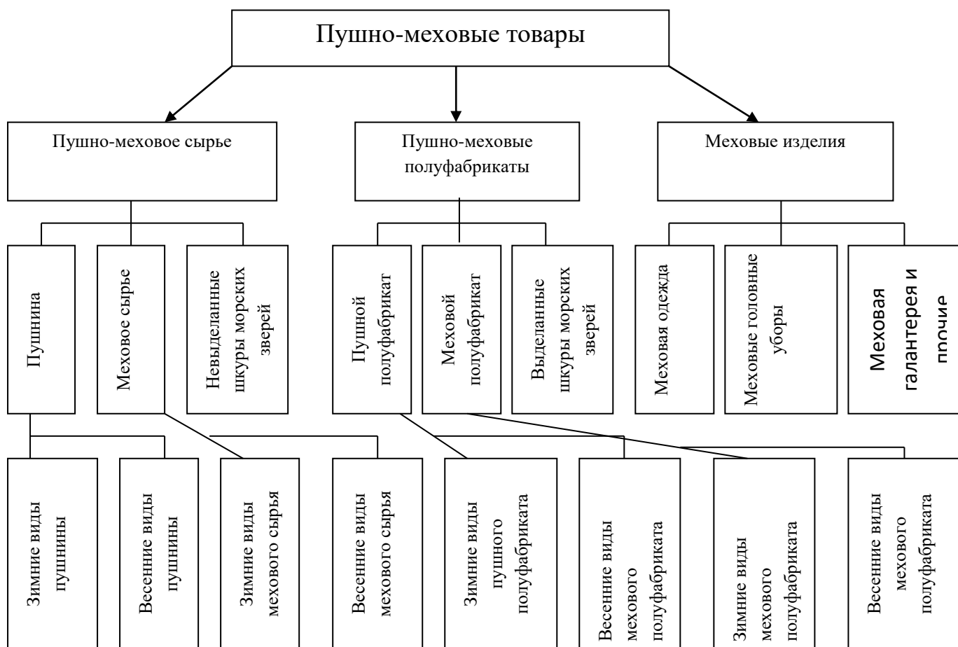
Рис. 1.1. Классификация пушно-меховых товаров

К пушно-меховому сырью относятся шкурки животных, имеющие достаточно развитый волосяной покров, которые были сняты с животных определенными способами, после чего подверглись консервации. У сырью также относится пушнина, мех и шкурки водных животных, не прошедшие выделку. (табл. 1.1)