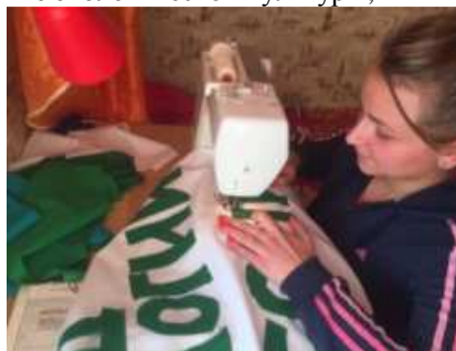
Рис. 6. Процесс пошива и дальнейшее использование флага, символизирующего официальную эмблему Года экологии в России-2017