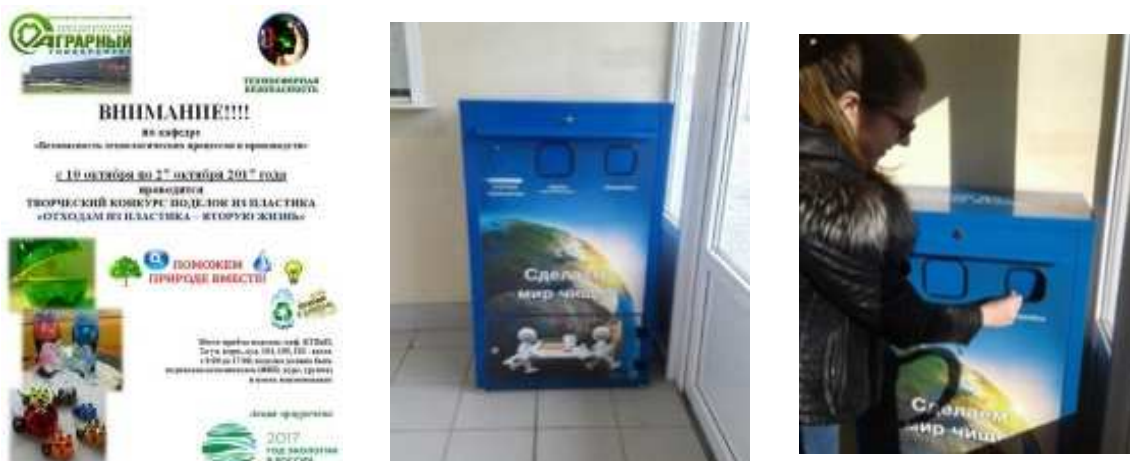
Рис. 4. Экотерминал при входе в 1-й уч. корпус СПбГАУ

энергосберегающих ламп и ртутных термометров, в Эко-пункт (экотерминал) СПбГАУ, размещённом в университете (рис. 4), участие в организации и проведении творческого Конкурса поделок из пластика «Отходам из пластика – вторую жизнь», что способствует воспитанию ответственного отношения к природе, осознанию необходимости сохранения окружающей среды;