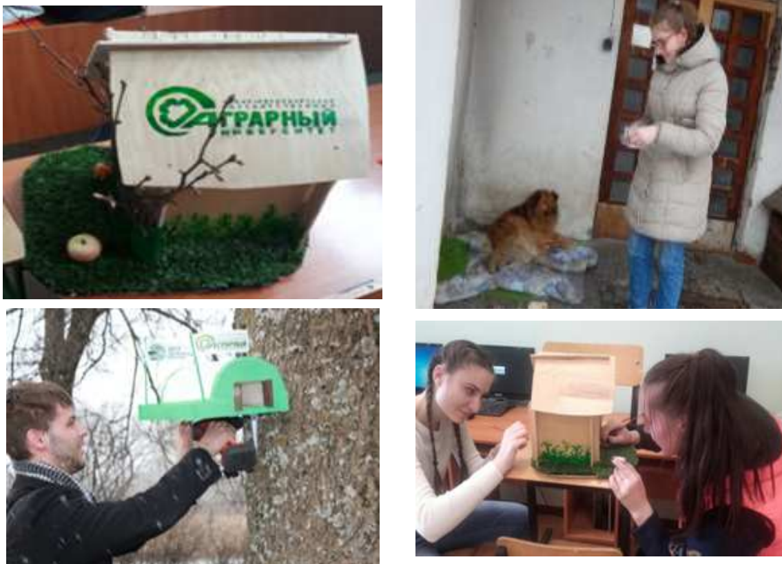
Рис. 5. Процесс изготовления скворечников обучающимися СПбГАУ

- участие обучающихся в решении проблемы бездомных животных на территории СПбГАУ, в изготовлении скворечников, приурочив это мероприятие к Международному дню птиц - 1 апреля (рис. 5), способствовало привлечению внимания общественности путем студенческой экологической инициативы к существованию проблемы бездомных животных и защите птиц и необходимости её решения;