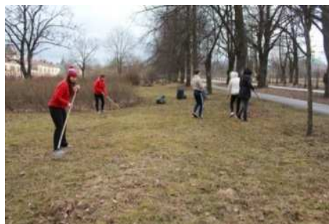
Рис. 1. Фотофрагменты реализации Экотрадиций 1 этапа

- участие в Международных научно-практических студенческих конференциях «Научный вклад молодых исследователей в сохранение традиций и развитие АПК», в конкурсах научно-исследовательских работ (НИРС) по темам экологической направленности, способствовало освоению приемов исследовательской деятельности, формированию приемов работы с информацией, развитию коммуникативных умений и овладению опыта межличностной коммуникации, корректному ведению диалога и участию в дискуссии;