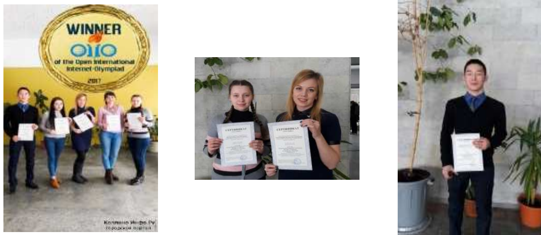
Рис. 3. Студенты СПбГАУ во втором туре Интернет-олимпиады по Экологии-2017

- участие обучающихся в различных форумах экологической направленности, в студенческих олимпиадах по дисциплине «Экология», что способствовало развитию любознательности и формированию интереса к изучению природы, определению уровня подготовки, знаний, личного отношения к определенным проблемам (рис. 3);