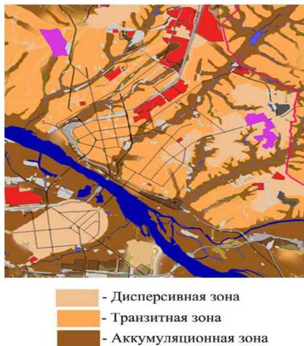
Рис. 2. Фрагмент модели распределения потоков загрязняющих веществ

Далее были осуществлены сбор и картографическое моделирование данных о загрязнении основных природных компонентов города. Использовались исходные данные, полученные Западно-Сибирским центром мониторинга окружающей среды и рядом организаций, ведущих исследования в области геологии, гидрогеологии и радиационной обстановки Новосибирской области (ГУФП «Березовгеология» и пр.) [5, 6]. Выполненный картографический анализ экологической обстановки на территории города позволил провести экологическое зонирование территории с определением комплексного показателя состояния окружающей среды (KPSOT) для каждой территориальной ячейки [7].