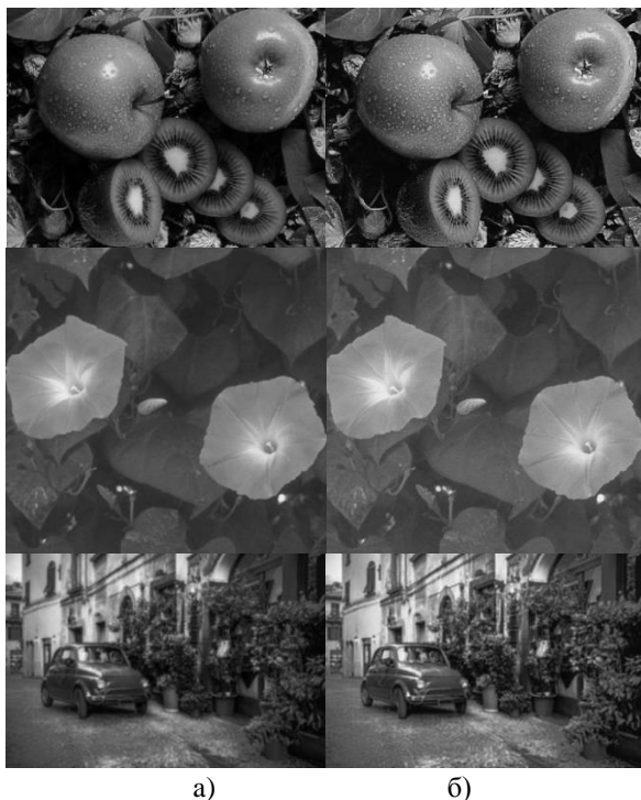
Рис. 3. Исходное изображение (а), изображение, обработанное ИНС (б)

При подаче на вход сети изображений (рис. 3а) на выходе были получены изображения с более высокими значениями резкости (рис. 3б).