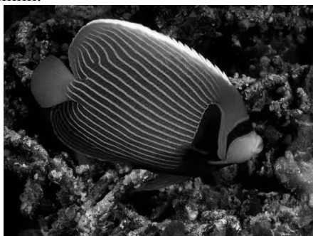
Рис. 4. Выбранный художественный образ

Материал для корпуса был выбран исходя из сравнительных преимуществ и недостатков нескольких материалов, таких как алюминий, пластик, нержавеющая сталь, и некоторые антивандальные покрытия. В итоге был выбран алюминий.