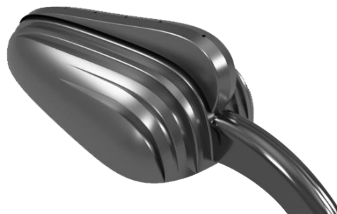
Рис. 5. Корпус магистрального светильника

Основание светильника выполнено в алюминиевом корпусе, конструкция которого позволяет достичь высокого уровня распределения тепла по всей поверхности. Корпус светильника также выполнен в алюминиевом корпусе, тем самым, способствуя поддержанию необходимого для светодиодов терморезима практически при любых климатических условиях. (Рисунок 5).