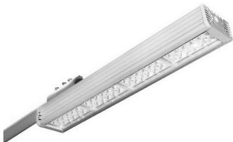
Рис. 1. Магистральный светильник

Светодиодные лампы начали стремительно развиваться благодаря своим высоким технологическим характеристикам и функциям, долговечности и экономичности. В настоящее время такие светильники используются для освещения магистральных дорог, садово-парковых территорий и различных площадок перед торговыми центрами. Использование их аргументируется тем, что магистральный светильник на светодиодах легко переносит перепады напряжения и суровые погодные условия. (Рисунок 1).