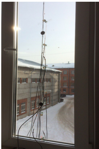
Рис. 1. Схема установки датчиков температуры по поверхности остекления

Для выполнения указанных задач, на первом этапе были проведены измерения тепловых характеристик окна по вертикальной оси на поверхности остекления в 10 точках согласно схеме, представленной на рисунке 1.