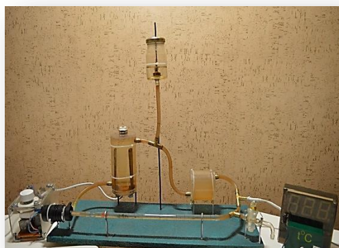
Рис. 4. Модель отопительной системы

Процесс нагрева в водонагревателе электродного типа происходит посредством протекания электрического тока через теплоноситель, за счет сопротивления которого и происходит нагрев. При этом явление электролиза не наблюдается, так как катод и анод постоянно меняются местами с частотой тока 50 Гц. Значит, нагревание происходит из-за колебательных движений заряженных частиц, и на выходе в считанные секунды теплоноситель нагревается до 95°C! Переменный ток не даёт оседать частицам на одном электроде, поэтому они всё время совершают колебательные движения, и при их взаимодействии происходит нагревание теплоносителя, при этом сам электрод, изготовленный из специального сплава, не нагревается и не окисляется. Поэтому гарантия данного устройства более 10 лет, о чем можно прочитать в техническом паспорте устройства. Вторым электродом служит сам цилиндрический корпус водонагревателя, поэтому при использовании его в бытовых условиях необходимо индивидуальное заземление. Таким образом, данная установка способна качественно отапливать помещение на протяжении длительного промежутка времени практически без ремонта и замены оборудования.