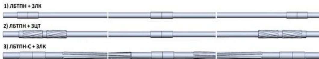
Рис. 2. Варианты компоновок бурильной колонны

По результатам исследований (табл. 1) был проведен сравнительный анализ, из которого можно сделать следующие выводы: ЛБТПН+ЗЦТ имеет наименьший эксцентриситет, следовательно лучшее центрирование бурильной колонны, наибольшие значения интенсивности турбулентности, по сравнению с другими компоновками. Однако у ЛБТПНС+ЗЛК наибольшие значения турбулентной длины и турбулентной энергии. Процесс транспортирования шлама у ЗЦТ происходит периодически с большой интенсивностью, в то время как у ЛБТПНС происходит постоянно, но с меньшей интенсивностью.