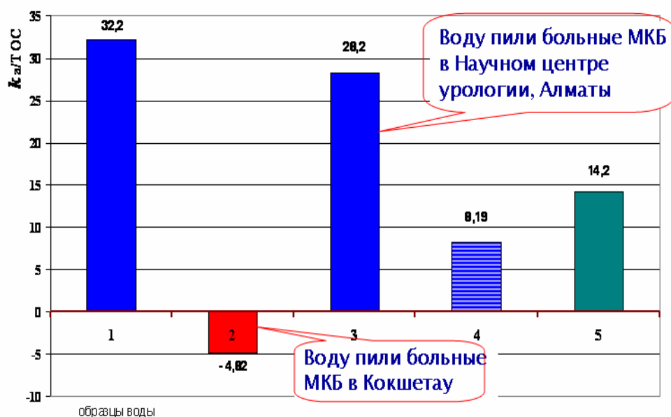
Рис. 2. График химической активности воды по отношению к железу Fe^{+3}

питьевой воды возвращает химическую активность органического соединения к активности исходной воды (рис. 2).