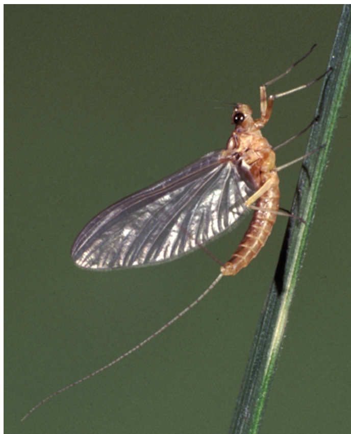
5. De eitjes van de haft Cloeon dipterum komen direct na watercontact uit, waardoor een relatief hoge 'per capita' investering mogelijk is. 5. In the ephemeropteran Cloeon dipterum a relatively high large 'per capita' investment is combined with ovovivipary.

ecologisch probleem dat 'van levensbelang' is. De oplossing gaat immers ten koste van investeringen in andere eigenschappen. Dit betekent dat informatie over de investeringen (de hoeveelheid tijd of energie) van een soort in bepaalde kenmerken zeer wezenlijk is voor het doorgronden van diens overlevingsstrategie. De grootte van een investering in een bepaalde eigenschap is lastig te bepalen, omdat de kosten en baten van dergelijke investeringen sterk afhangen van de beperkingen en mogelijkheden die voortvloeien uit het bouwplan van de soort, zijn dieet en overige eigenschappen. Of een eigenschap (relatief sterk ontwikkeld is, wordt met name duidelijk door verwante soorten te vergelijken, aangezien deze deels dezelfde beperkingen en mogelijkheden kennen.