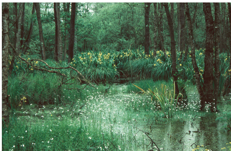
1. Een grote verscheidenheid in het Korenburgerveen, illustratief voor de variatie aan watertypen. Links: veenplas, gedomineerd door veenpluis ( Eriophorum angustifolium ) en veenmossen ( Sphagnum spp). Rechtsboven: matig voedselrijke poel met grote lisdodde ( Typha latifolia ) en drijvend fonteinkruid ( Potamogeton natans ). Rechtsonder: nat elzenbroekbos met zwarte els ( Alnus glutinosa ) en waterviolier ( Hottonia palustris ).