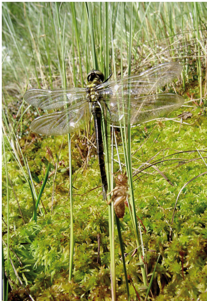
2. Uitsluitend vrouwtje van de Hoogveenglanslibel Somatochlora arctica (Zetterstedt). De ontwikkeling van de larven kan tot wel drie jaar in beslag nemen.