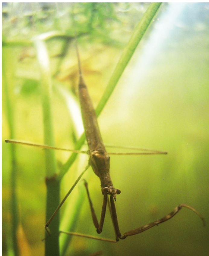
4. De staafwants ( R. linearis ) combineert een snelle larvale ontwikkeling met langlevende adulten die zich voeden. 4. The water stick insect R. linearis combines a rapid larval development with long-lived, feeding adults.