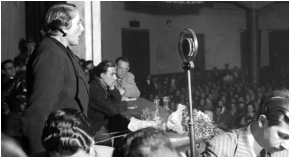
Ilustración 2: Célebre discurso de Dolores Ibárruri "La Pasionaria" de despedida a los voluntarios de las Brigadas internacionales, pronunciado el 1 de noviembre de 1938. Recuperado: https://discursosparalahistoria.wordpress.com/2010/02/12/hasta-pronto-hermanos-de-dolores-ibarruri/