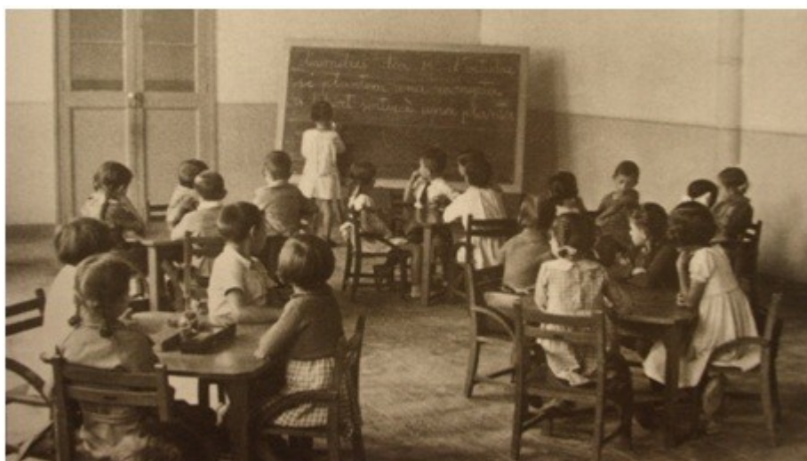
Ilustración 1: Tristán, Flora (1932). Clase de primaria (A escola da Segunda República).

Podemos observar que la educación fue un papel fundamental en la transformación del pensamiento social. Las mujeres defendieron la educación como fuerza civilizadora del mismo modo que atribuían gran importancia a su dignificación. De la misma forma que lo defendía Berta Wilhelmi, que publicó un escrito en el Boletín de la Institución Libre de Enseñanza donde defendía el hecho de que si la mujer pide por derecho propio el ejercicio de todas las profesiones [...], creemos que pide lo justo: pide la rehabilitación de media humanidad (Wilhelmi, 1893).