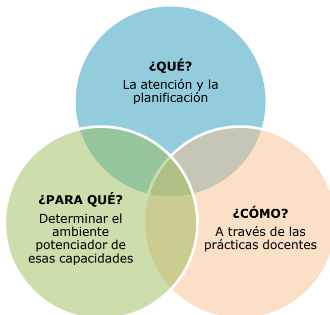
Figura 1. Componentes del conocimiento del profesorado que se manifiestan en el cuestionario.