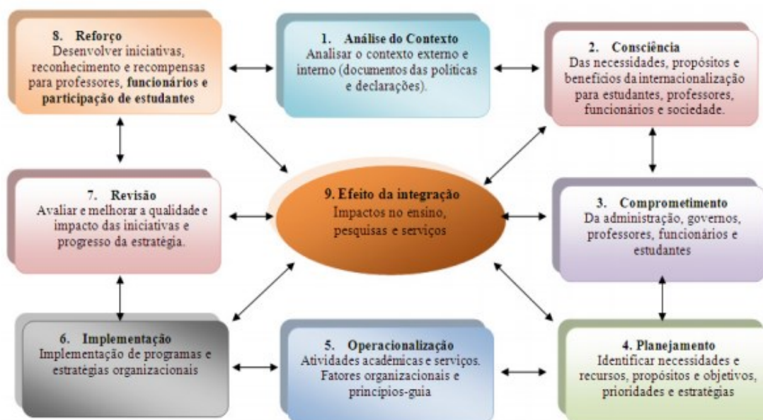
Figura 1: Círculo da Internacionalização - versão atualizada por Knight (2004)

Para efeito do monitoramento e avaliação do modo pelo qual as estratégias de internacionalização vêm sendo implementadas, geridas e avaliadas no âmbito das IES, foi apresentada por Knight (1994) o Ciclo de Internacionalização, que visa a alcançar uma análise ampla desse processo através de uma série de passos interconectados, desde o nível imaterial — que compreende aspectos como a conscientização, motivações e comprometimento — ao real concreto — para verificação das atividades planejadas, desenvolvidas e controladas.