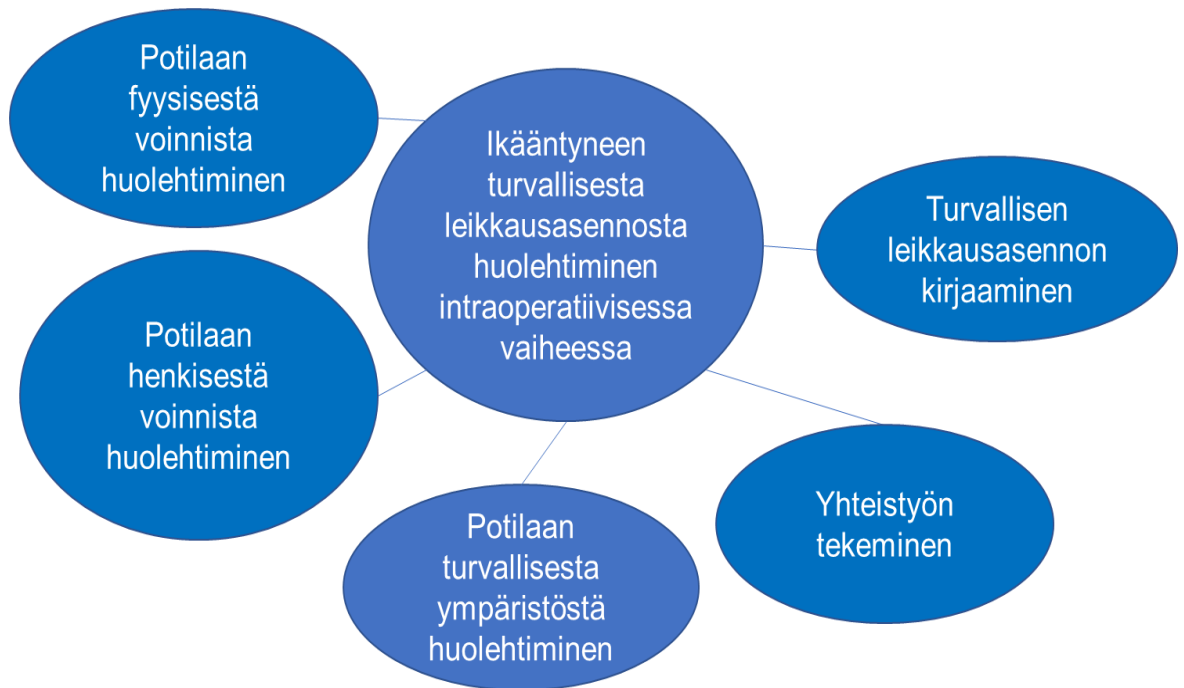
Kuvio 2. Ikääntyneen turvallisesta leikkausasennosta huolehtiminen intraoperatiivisessa hoitovaiheessa.