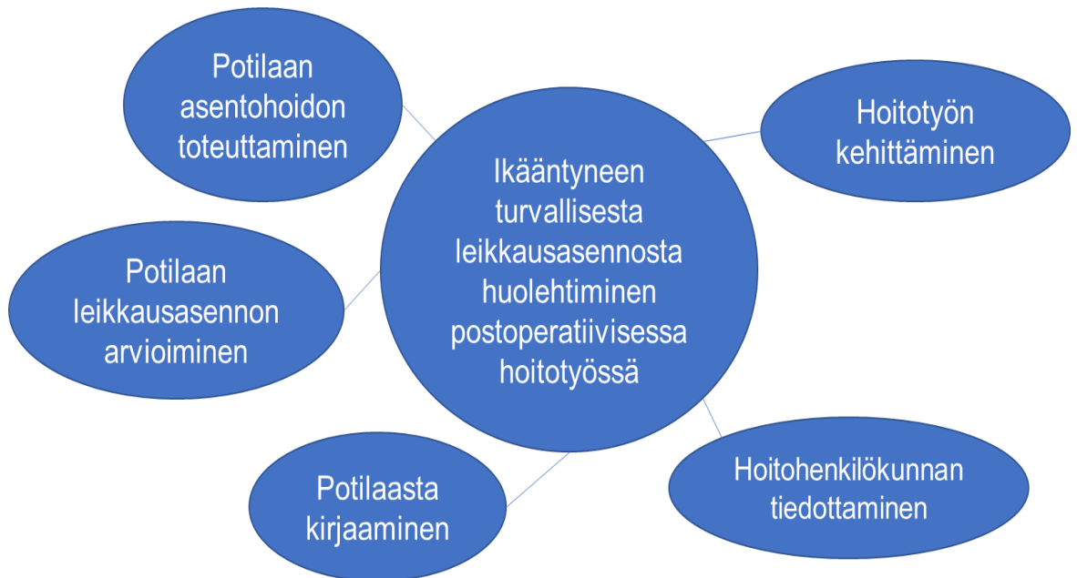
Kuvio 3. Ikääntyneen turvallisesta leikkasasennosta huolehtiminen postoperatiivisessa hoitovaiheessa.

Ikääntyneen turvallisesta leikkasasennosta huolehtiminen postoperatiivisessa hoitovaiheessa (Kuvio 3.) oli potilaan asentohoidon toteuttamista, potilaan leikkasasennon arvioimista, potilaasta kirjaamista, hoitohenkilökunnan tiedottamista ja hoitotyön kehittämistä.