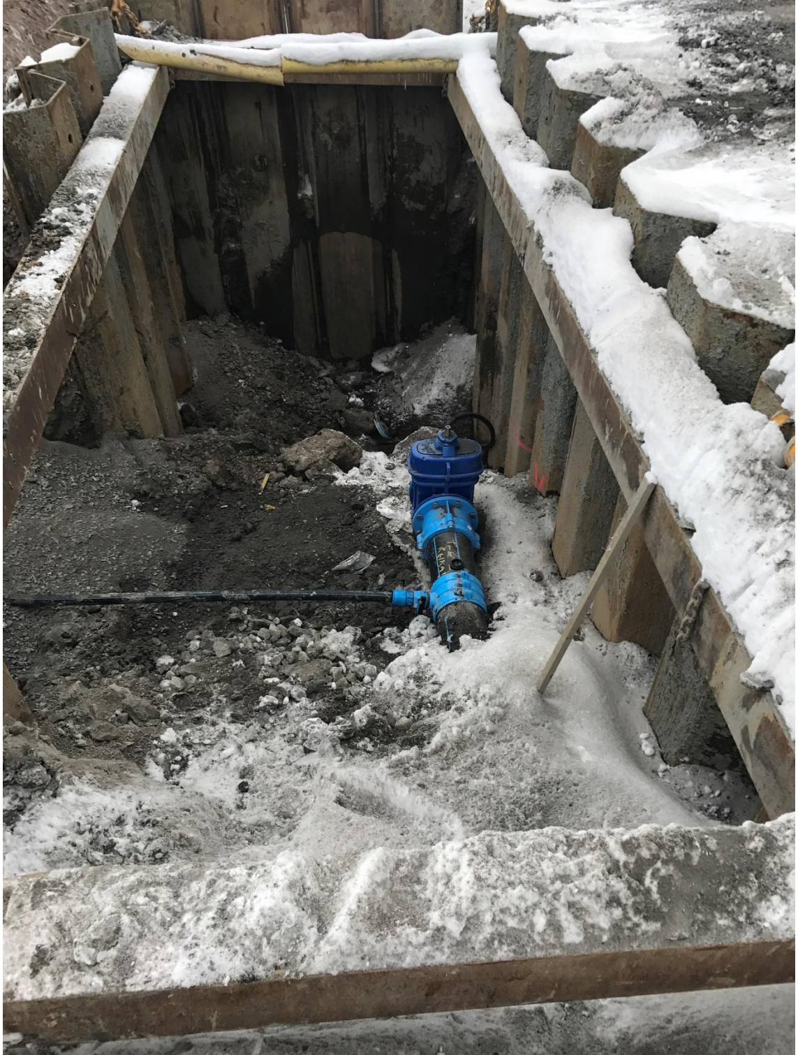
Kuva 3. Vesijohtoa ja toimilaitteita asennettuna tuetussa kaivannossa.