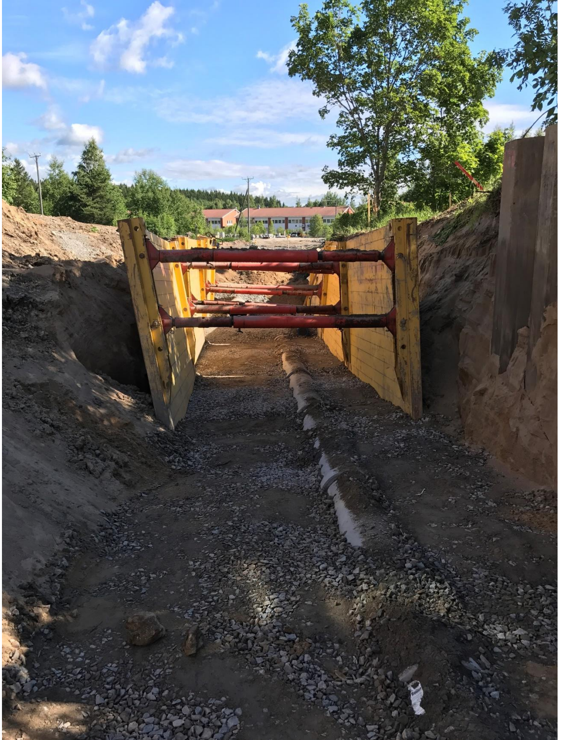
Kuva 1. Elementituella tuettua kaivantoa.