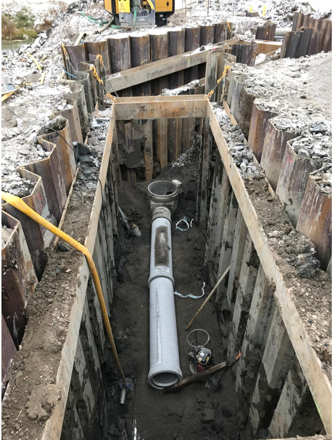
Kuva 2. Ponttiseinällä tuettu kaivanto.

Ponttiseinätuenta on ponttilankuista, yleensä yhtenäinen, toisiinsa lukkoon lyöty maansäinen seinärakenne, joka tarvittaessa tuetaan esimerkiksi palkkirakentein toisiinsa tai ankkurein kallioon, (Jääskeläinen 2009, 180 – 189, kuva 2.)