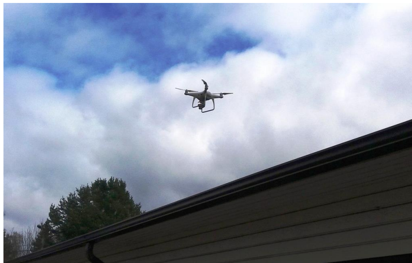
KUVA 2. Dronen avulla tarkistetaan vesikourujen kuntoa

Suojelukohteena olevia kulttuurihistoriallisia rakennuksia tulee huoltaa ja korjata säännöllisesti niiden kunnan ja arvon säilyttämiseksi. Kyse on myös valtion omaisuuden hallinnasta ja turvallisuudesta. Vilppulan vankilan rakennukset ovat keskimäärin kolmekerrosrakennuksia ja dronen avulla on mahdollista saada nopeasti ja helposti kuvaa esim. vesikourujen, savupiippujen ja katon tilasta kuntokartoituksen ja tulevien huolto- toimenpiteiden avuksi. Tällä on merkittävä vaikutus työturvallisuuteen ja kustannussäästöihin, koska vältetään erikseen tilattavien nostureiden ja muiden apuvälineiden käytöltä.