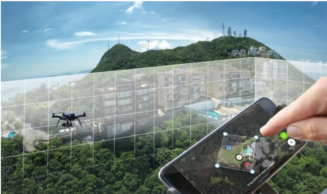
KUVA 3. Virtuaalinen geoaita (Anderson 2016)

Business Insider -lehti listasi heinäkuussa 2017 artikkelissaan suurimmat laitevalmistajat ja sen mukaan kiinalainen DJI oli markkinajohtaja 70 % :n osuudella, mutta markkinoiden kasvaessa räjähdysmäisesti uusia vartenotettavia toimijoita tulee koko ajan markkinoille. (Joshi 2017). Harkinnan jälkeen laite-ehdotus sisälsi lopulta kolme Yuneecin dronea ja yhden DJI:n dronen ja harkittuaan eri vaihtoehtoja Vilppulan vankila päätyi hankkimaan Yuneecin Typhoon H RealSense kopterin.