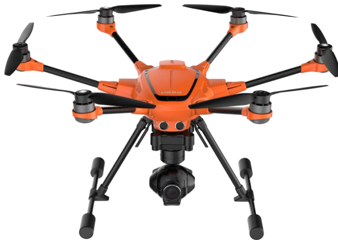
KUVA 1. Yuneec H520 heksakopteri E50 kameralla

Drone on yleiskielessä käytetty ilmaisu, joka kattaa kaikenlaiset miehittämättömät lennot ja kauko-ohjattavat ilma-alukset. Trafi kuitenkin erittelee lennokin, miehittämättömän ilma-aluksen ja kauko-ohjattavan ilma-aluksen perustuen laitteen käyttötapaan ja -tarkoitukseen. Tässä työssä drone tarkoittaa kauko-ohjattavaa miehittämätöntä ilma-alusta, joka on varustettu kameralla, GPS:llä sekä niihin kytkettävillä ohjaus- ja seurantayhteyksillä (RPAS = Remotely Piloted Aircraft System).