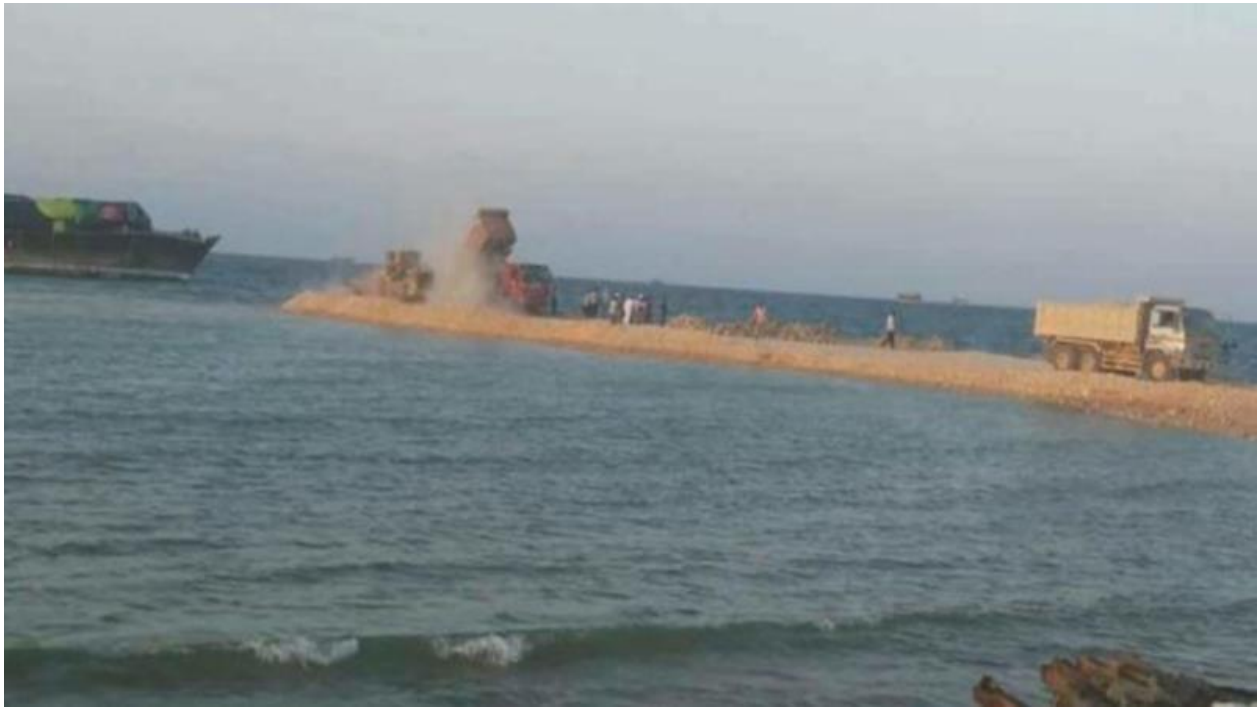
Kuva 1. Tavalliset kaupunkilaiset pelastavat karille menneen laivan rannan tuntumassa.