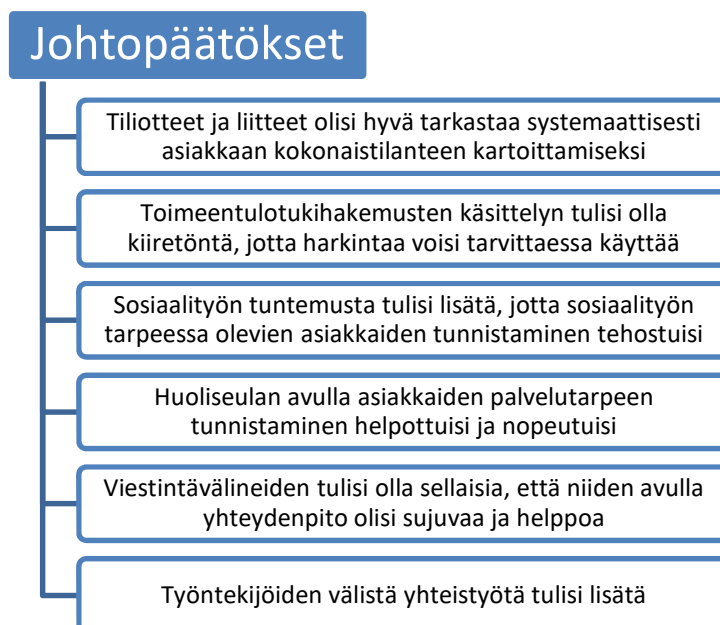
KUVIO 4. Johtopäätösten yhteenveto.

Toimeentulotuki on monimutkainen etuus, sillä sitä tarvitsevat ihmiset ovat hyvin erilaisissa elämäntilanteissa. Tämän vuoksi täysin yhdenmukaisia myöntämiskäytänteitä on vaikea asettaa. Joillakin asiakkailla sosiaalityön tarve on suurempi ja joillakin on tarvetta vain taloudelliseen tukeen. Yhtenäisiä myöntämiskäytänteitä on vaikea toteuttaa, vaikka tuen myöntäminen onkin siirtynyt Kelalle. Yhteisistä myöntämiskäytänteistä huolimatta perustoimentulotuen myöntämisessä tulisi käyttää myös harkintaa. Asiakkaat voivat olla edelleen eriarvoisessa asemassa keskenään, jos osa etuuskäsittelijöistä ei käytä harkintaa ja osa käyttää. Asiakkaiden yhdenmukainen kohtelu on Kela-siirron keskeisimpiä tavoitteita ja kansalaisten tasa-arvoa lisäävä asia.