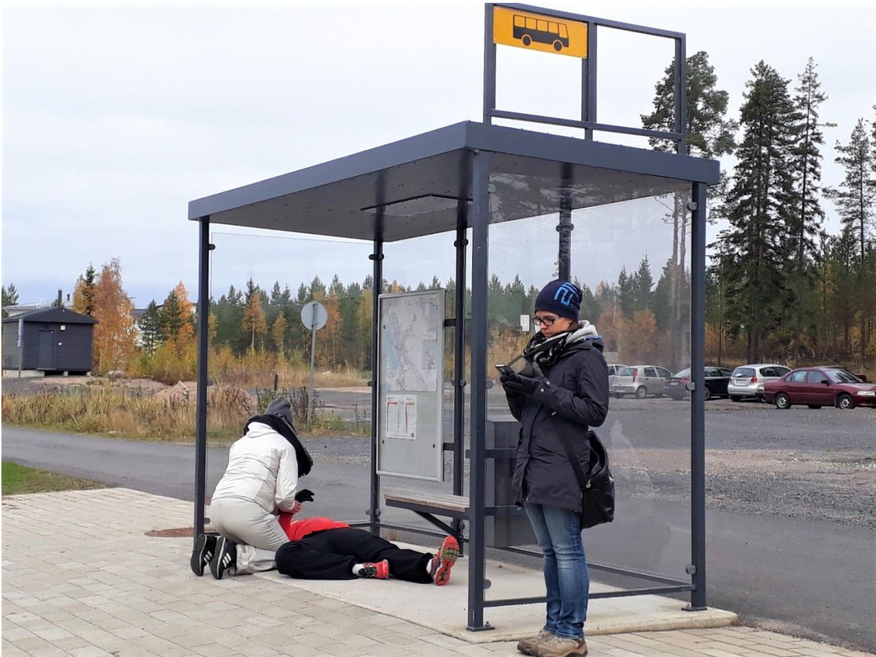
KUVA 3. Missä tahansa voi kohdata apua tarvitsevan ihmisen