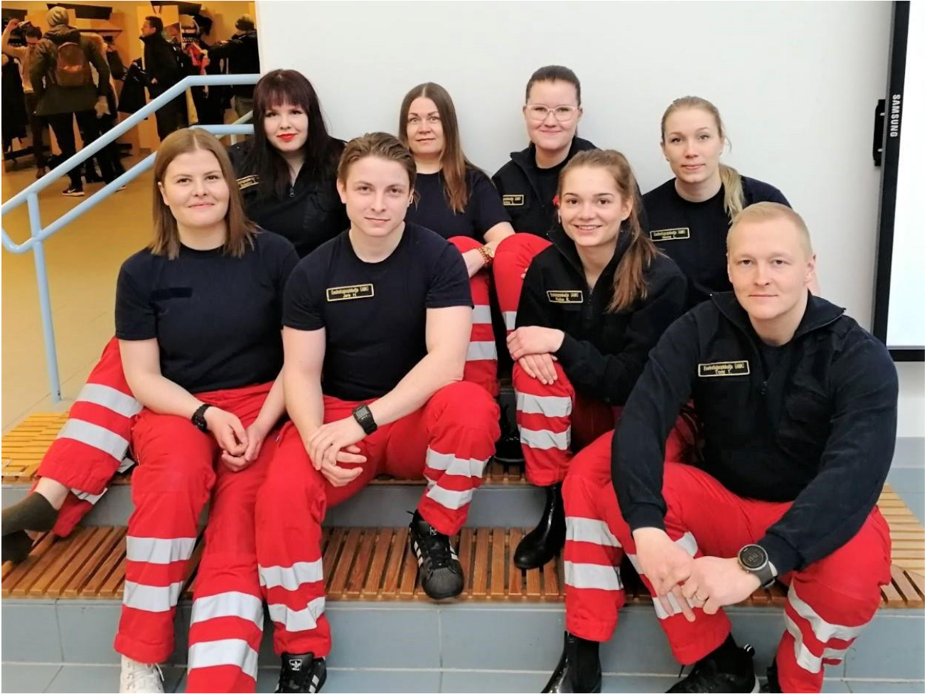
KUVA 1. Ensihoidon opiskelijat lähtivät porukalla tekemään ensiapukursseja verkkoon. Kuvassa ei ole koko projektiryhmää