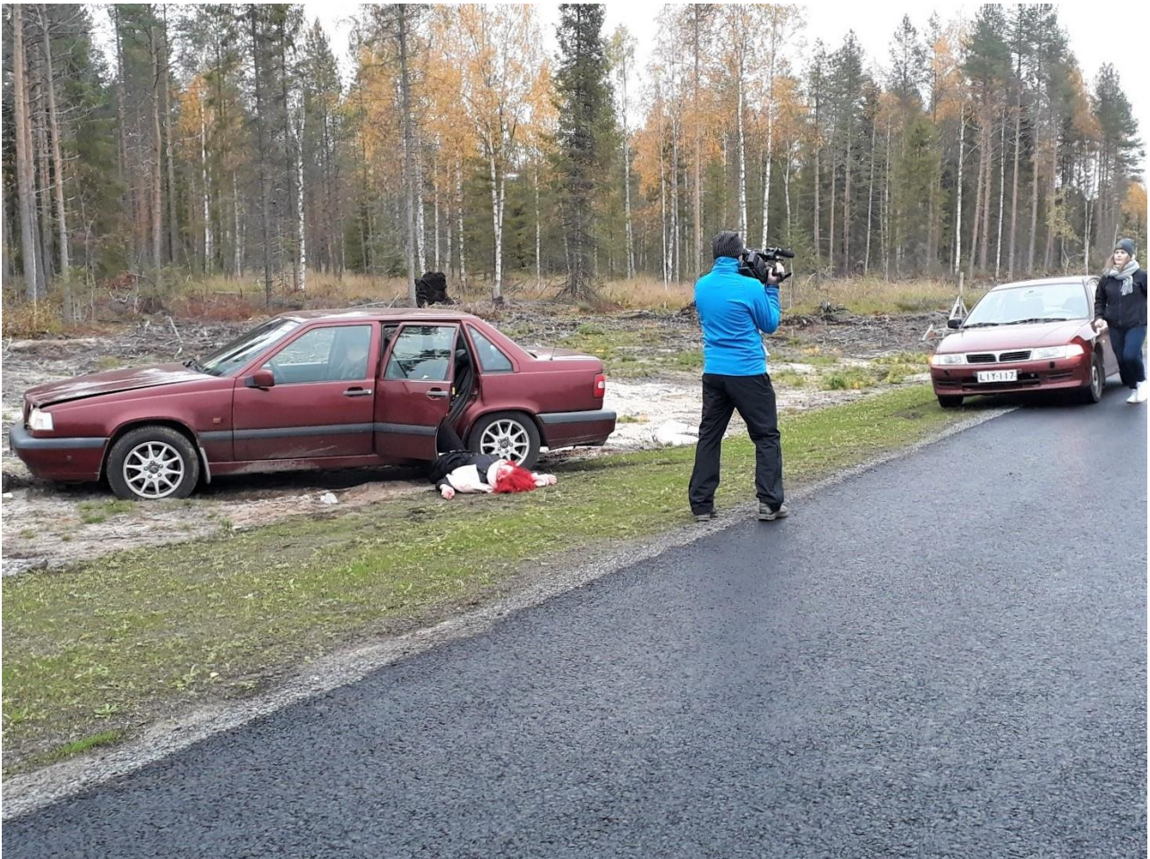
KUVA 2. Kohtauksia jouduttiin kuvaamaan useaan otteeseen

Kuvauspaikoilla jokaisesta kohtauksesta otettiin monta otosta eri kuvakulmista, jotta videoiden editointivaiheessa olisi vaihtoehtoja, mistä valita. Kohtaukset piti saada liitettyä yhdeksi videoksi saumattomasti, siksi jo kuvauspaikalla piti miettiä esimerkiksi näyttelijöiden asennot kohtauksen lopussa ja seuraavan alussa. Oulu-Koillismaan pelastuslaitos antoi kuvauksiin kaksi ensihoitajaa ja ambulanssin, näin videoista saatiin mahdollisimman todentuntuiset. Videoilla haluttiin painottaa, että on tärkeää ohjata ammattiapu oikeaan paikkaan, eikä avunantoa saa lopettaa ennen kuin paikalle saapuvat ensihoitajat antavat siihen luvan. (Kuvat 2 ja 3.)