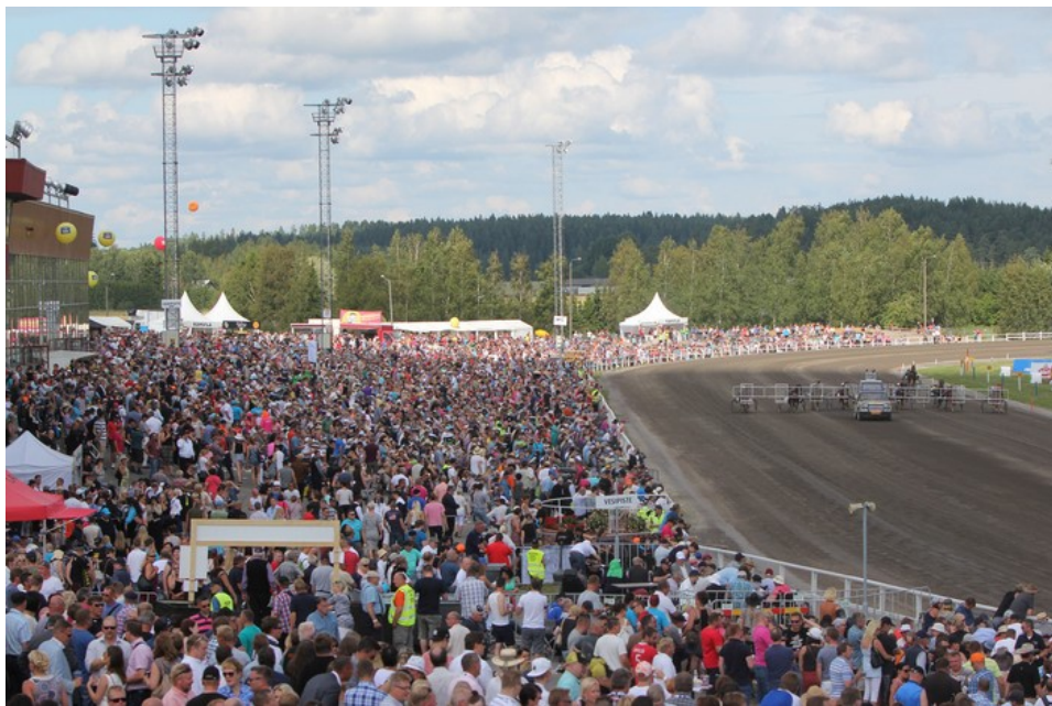
Kuva 1. Yleisömeri Turun 2016 Kuninkuusraveissa (Suomen Hippos 2017).

Kuninkuusravit on ollut suomenhevosen juhlaa jo vuodesta 1924. Nykyään vuosittain heinä-elokuun vaihteessa järjestettävä kilpailu on eräänlainen suuren luokan kansantapahtuma, johon kerääntyy eri-ikäisiä ihmisiä ympäri Suomea seuraamaan maamme parhaimpien suomenhevosori- en ja -tammojen kilvanajoa (Kuva 1). Koska Kuninkuusravit on hyvin perinteikäs tapahtuma, kerää se vuosittain viikonlopun aikana kymmeniätuhansia katsojia, mikä takaa myös median kiinnostuksen tapahtumaa kohtaan. Perinteiden tuoma perusjulkisuus edesauttaa tapahtuman markkinointia. (Kuninkuusravit n.da.)