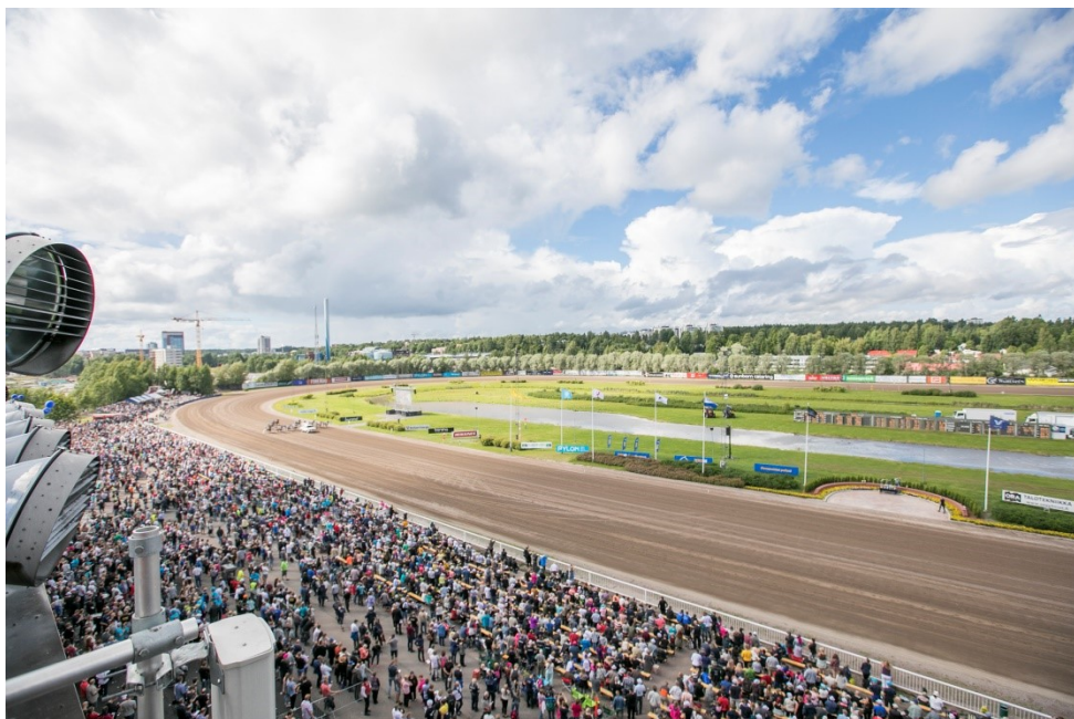
Kuva 4. Kuvassa näkyy monia eri sponsoriyhteistyön muotoja, esimerkiksi liput saloissa, aitamainokset ja screeni (Laakso 2017).

Aitamainokset kiinnitetään raviradan aitoihin tai keskikentälle, samalla tavalla kuin muissakin urheilulajeissa. (Kuva 4) Aitamainoksissa on vuosihinta, mutta sopimus voidaan tehdä useammalle vuodelle (Pilvenmäki 2015c).